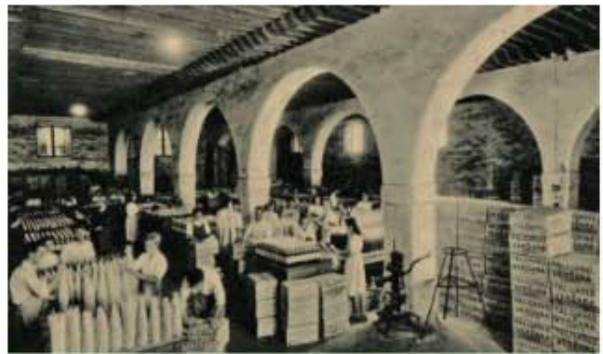
Interior de una bodega de Jerez de la Frontera. Tarjeta postal de la década de 1920.

La agroindustria también ha sido un sector clave .Desde ciudades medianas o grandes como Jerez de la Frontera y su industria de vino ,a pequeños núcleos como Benalúa de Guadix y su histórica Industria azucarera