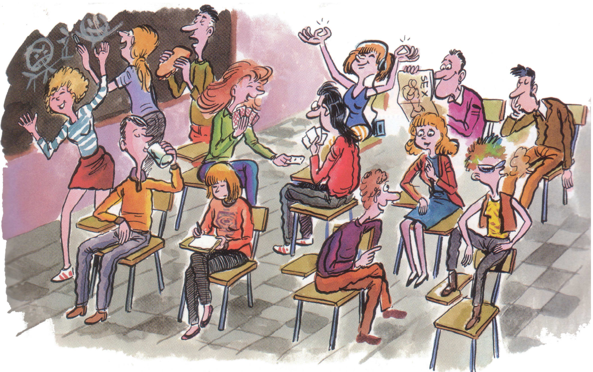
Imagen extraída de: Virgilio Borobio, Nuevo ELE. Curso de español para extranjeros. Inicial 2. Ed. S.M., 2001.

1. Explica qué están haciendo estas personas.