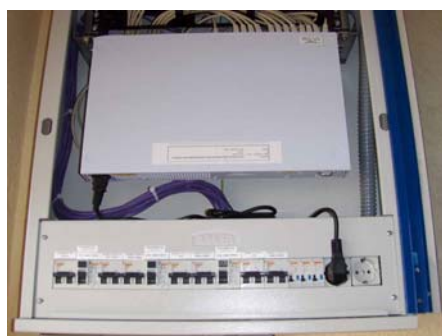
Cuadro eléctrico aula TIC