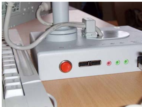
Imagen 5 (botón rojo peana monitor)

2. Las alumnas y alumnos entrarán en Guadalinux usando su nombre de usuario y contraseña, no está permitido entrar en el sistema usando el usuario genérico (usuario-usuario) sin la autorización del maestro o maestra responsable.