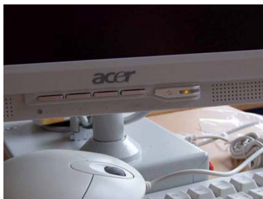
Imagen 1 (botón encendido monitor)