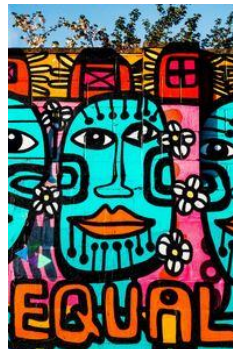
Plan de Igualdad.