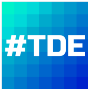
Transformación Digital Educativa.