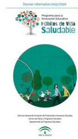
Creciendo en Salud.