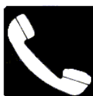
Teléfono de salvamento