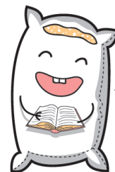
CEIP “LA ALMOHADA” Belicena

COMIENZA LA AVENTURA... SEMANA CULTURAL 2021