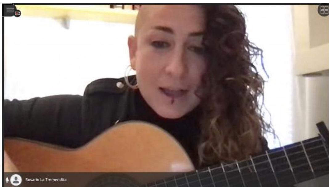
Imagen del streaming de Rosario La Tremendita

La jornada se celebró el 19 de noviembre. A las 11:00 apareció la artista en todas las pantallas del centro, todo el alumnado pudo ver en “STREAMING” a la cantante. La jornada daba comienzo con un video de La Tremendita captando la atención de los cerca de 500 alumnos/as del colegio . Después de una emotiva bienvenida y el saludo de Rosario a todos y cada una de las 19 aulas que integran el CEIP Rafael Alberti, deleitó a todo el alumnado y al profesorado de su arte y de su voz.