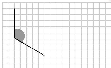
UN ÁNGULO MAYOR