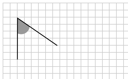
UN ÁNGULO MENOR