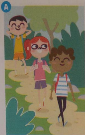
Ayer ... de excursión.

1 Completa en tu cuaderno las oraciones con el verbo que falta.