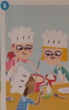
Hoy ... un pastel.