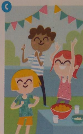
Mañana ... una fiesta.

Los verbos se pueden usar en tres tiempos: