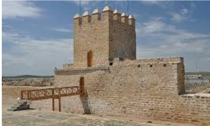
FORTALEZA DE LA CULEBRA