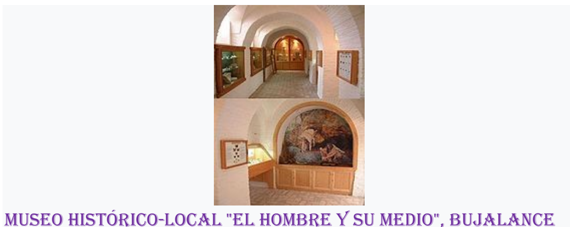
MUSEO HISTÓRICO-LOCAL "EL HOMBRE Y SU MEDIO", BUJALANCE