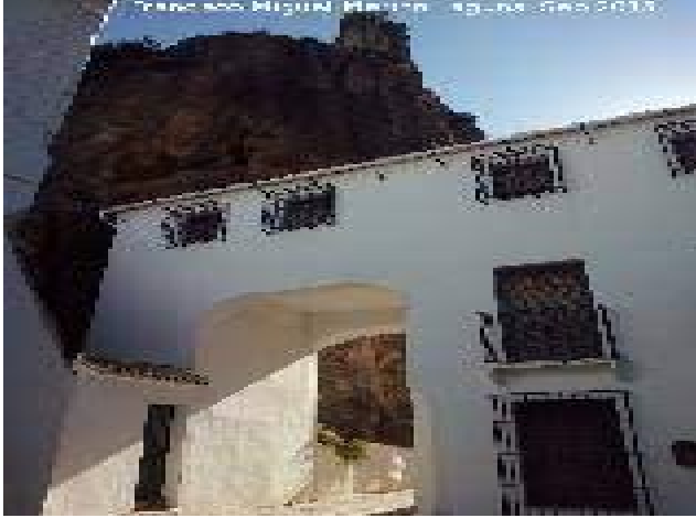
Arcos en la calle Molinos