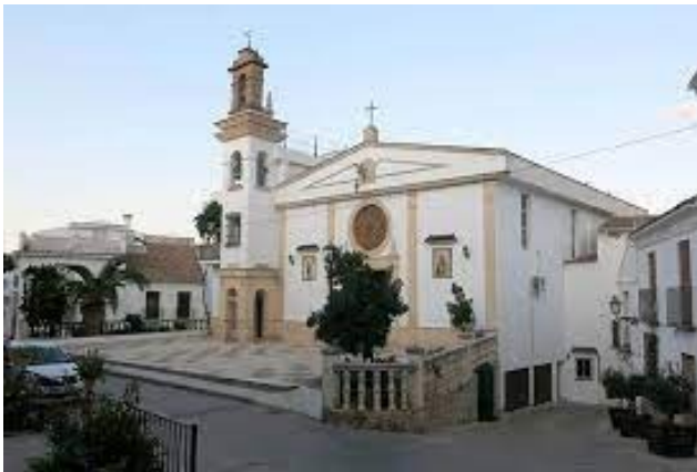
Parroquia de san Juan Bautista