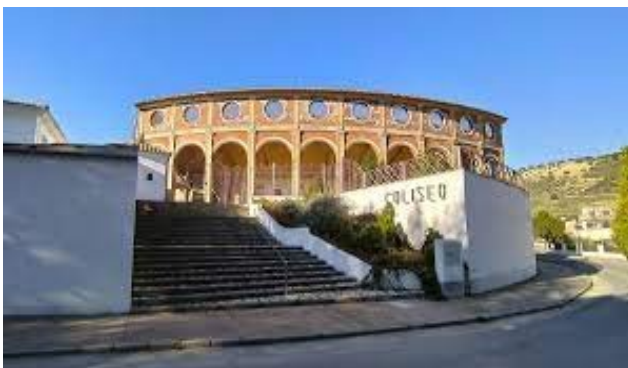
Plaza de toros (COLISEO)