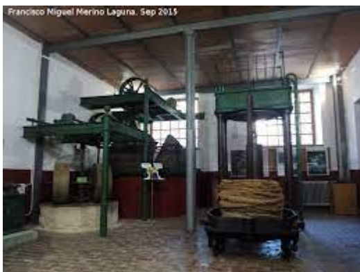
SALA DEL ACEITE

El Museo Histórico-Arqueológico de Almedinilla fue creado por acuerdo plenario del ayuntamiento de Almedinilla, en sesión celebrada el día 30 de julio de 1994, ratificado en el Pleno celebrado el día 11 de mayo de 1995, para la promoción y fomento de la cultura, como un servicio municipal que reúna y conserve con fines de investigación, educación, disfrute y promoción científica, un amplio conjunto de testimonios de la actividad del hombre y su entorno natural, para el conocimiento de la historia, la antropología y el arte del término municipal. Finalmente fue inaugurado en 1999 con un espacio de 1200 metros cuadrados divididos en tres salas: Sala del Aceite, Sala Íbera y Sala Romana.