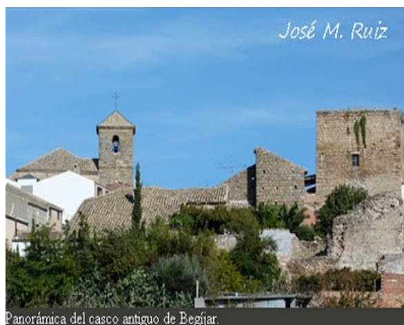
Panorámica del casco antiguo de Begíjar.

En España, un conjunto histórico-artístico es una declaración legal que agrupa a todos los bienes declarados como monumentos históricos-artísticos en una determinada localidad, siendo una figura de protección sobre los bienes culturales españoles y que se encuentra regulada por el Ministerio de Cultura de España. Determina la agrupación de inmuebles que forman una unidad de asentamiento, continua o dispersa, condicionada por una estructura física representativa de la evolución de una comunidad humana por ser testimonio de su cultura o constituir un valor de uso y disfrute para la colectividad. Asimismo, es Conjunto Histórico cualquier núcleo individualizado de inmuebles comprendidos en una unidad superior de población que reúna esas mismas características y pueda ser claramente delimitado.