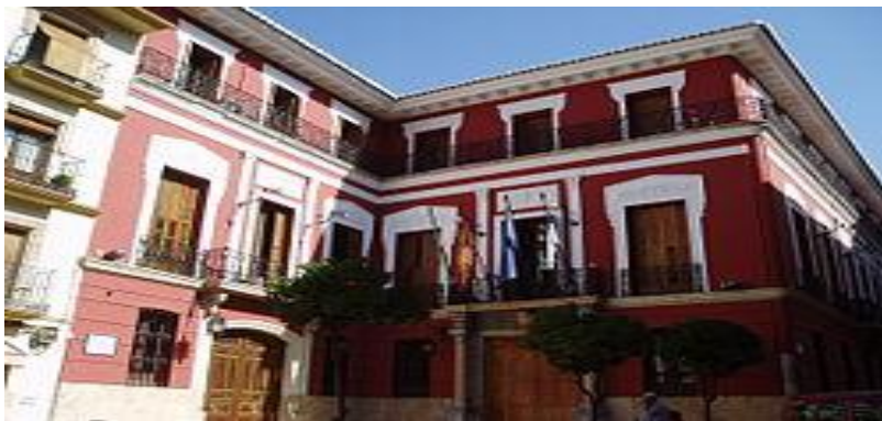
Palacio de Narváez, sede del actual ayuntamiento, en la calle Duque de Valencia.