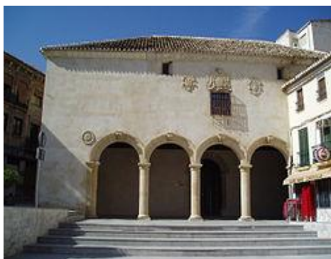
Pósito de Loja

El pósito de Loja se dispuso en la plaza que recibió más tarde el nombre de Plaza de Abajo o de Joaquín Costa. Se construyó a finales del siglo XVI ya como pósito o granero público. Se cuenta que fueron varios vecinos los que en 1535 solicitaron al Cabildo su construcción. Así Juan de Maeda realizaría su traza y condiciones del pósito aunque más tarde se llevarían a cabo dos ampliaciones que quedaron patentes en sendos medallones en su portada aludiendo al año de realización de las mismas (1650 y 1780) entre la heráldica real de Felipe II.