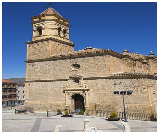
Portada renacentista de la Iglesia de San Gabriel, en Loja