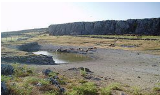
El charco del Negro, en verano.

Además es digno de resaltar el lago de origen glaciar situado en la sierra de Loja y conocido como el Charco del Negro, lugar donde tiene su hábitat el anfibio llamado gallipato.