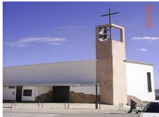
IGLESIA DE LOS VENTORROS DE SAN JOSE