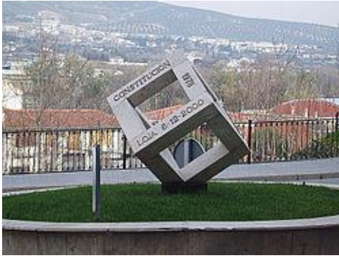
Monumento a la Constitución Española de 1978 en Loja.