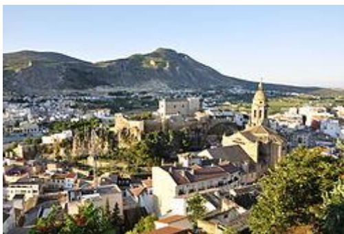
Alcazaba de Loja

Los monumentos más significativos de la ciudad son la Alcazaba —fortaleza árabe construida a finales del siglo IX—, las iglesias de San Gabriel, de Santa Catalina, la Iglesia Mayor de la Encarnación, el Convento e Iglesia Conventual de Santa Clara, el Pósito, el Palacio de Narváez y la Fuente de los Veinticinco Caños. Muchos de ellos están declarados bienes de interés cultural.