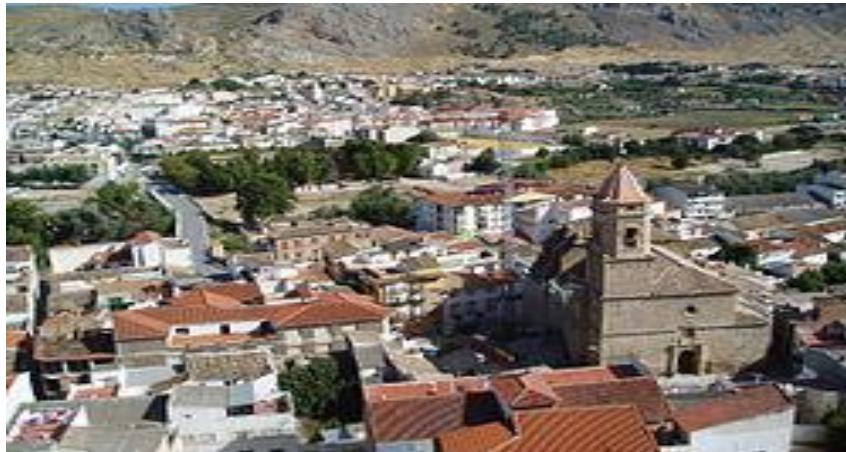
Vista de Loja desde el mirador de la Alcazaba.

En cuanto al origen del nombre, el historiador Francisco Javier Simonet registra Lauxa , ( Lawša ) lapis , de los «autores árabigos», y la relaciona con Laus e Ilipula Laus de Plinio.