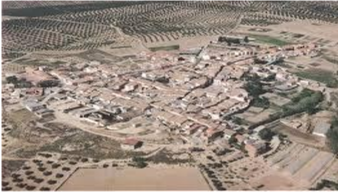
La riqueza arqueológica de Lupión