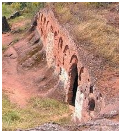
Oratorio de Valdecañales.

Torreón árabe: Sólo queda en pie un torreón árabe de los tres que formaban el antiguo castillo-fortaleza del siglo XIII. Es de mampostería, tiene doce metros de perímetro y sus huecos están constituidos por saeteras y desagües.