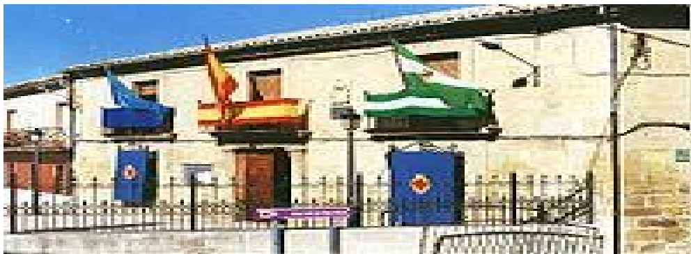
Ayuntamiento de Rus

Rus está situado en el centro de la provincia y al sur del río Guadalimar. Geográficamente está entre los 38° 3' de latitud N y los 3° 27' de longitud O (IEA-SIMA). Su altitud media es de 590 m y es atravesado por la N-322 (Bailén-Requena). Dista 52 km a Jaén, 20 km de Linares, 9 km de Úbeda y 7 km de Baeza. Está muy bien comunicada y pertenece a la comarca de La Loma. Su población se estima en 3.668 habitantes (INE 2016) y su densidad de población es de 80,36 hab./km 2 . En su término municipal de 47,3 km 2 se encuentra una Entidad Local Autónoma (E.L.A.), El Mármol, que tiene aproximadamente entre 200 y 300 habitantes. Se caracteriza por ser un municipio anejo de la ciudad de Úbeda de la que depende económicamente.