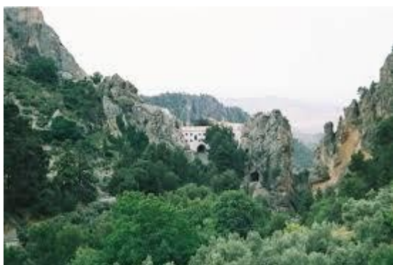
Santuario de la Virgen de Tisca

Por otra parte, el primer sábado de mayo, se hace una romería para traer a la Virgen de Tíscar de vuelta al pueblo. Es conocida como el día de "la traída de la Virgen". La Virgen atraviesa el pueblo hacia la iglesia donde permanecerá hasta finales de agosto. Durante el trayecto los quesadeños lanzan loas y pétalos de rosas y en el manto de la