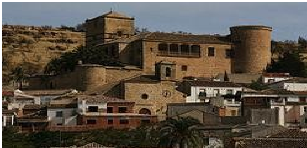
Castillo de Canena.