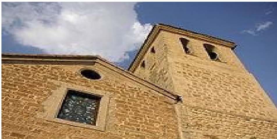
Iglesia de San Pedro y San Pablo, en la Plaza de la Lonja