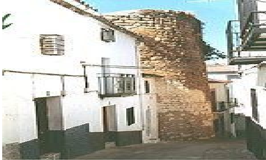
Torreón árabe del siglo XIII.

Torreón árabe: Sólo queda en pie un torreón árabe de los tres que formaban el antiguo castillo-fortaleza del siglo XIII. Es de mampostería, tiene doce metros de perímetro y sus huecos están constituidos por saeteras y desagües.