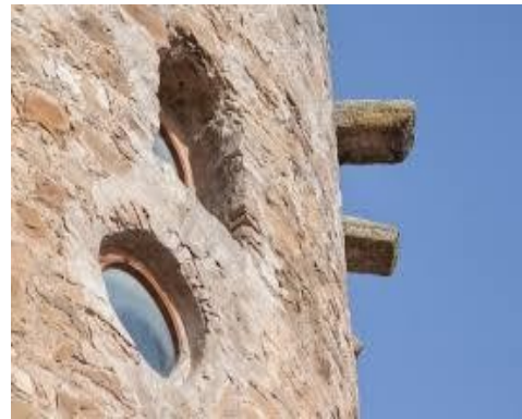
Torreón de lupión