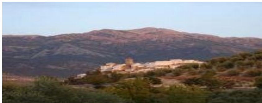
Quesada al atardecer