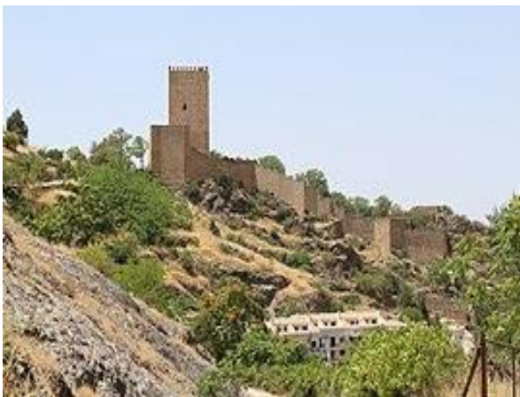
CASTILLO de la YEDRA

El Castillo de la Yedra: en el cerro de Salvatierra, de construcción cristiana, realizada sobre otro castillo árabe de los siglos XI y XIII. En buen estado de conservación, alberga en su interior el Museo de Artes y Costumbres Populares del Alto Guadalquivir . Este se encuentra dividido en dos secciones: la de Historia, situada en la torre del homenaje, y la de Artes y Costumbres, en un edificio anexo a la anterior.