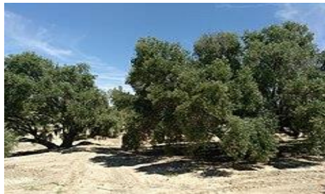
Olivos centenarios de la Candonga, uno de los reclamos del oleoturismo en Martos

Por otra parte es un hecho destacable el auge que está cogiendo en Martos un nuevo modelo de Turismo ecológico, el Astroturismo fortalecido gracias a declaración de la Sierra Sur de Jaén como Reserva Astronómica Internacional Starlight por la Fundación Starlight y apoyada por la Unesco y la Asociación Astronómica Hubble, distinción que identifica a Martos y su comarca como destino turístico Starlight gracias a sus cielos nocturnos limpios y no contaminados. A raíz de esta declaración y consolidación de este tipo de turismo se ha creado en Martos la empresa AstroÁndalus, la primera agencia de viajes en línea que opera en España y especializada en turismo astronómico y científico, con el objetivo de ofrecer destinos y experiencias turísticas vinculadas a la observación del firmamento.