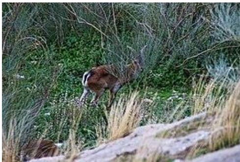
Cabra montes en la Sierra de Martos