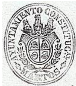
Antiguo sello de la alcaldía de Martos

En 1833, durante la regencia de María Cristina, se creó una división territorial de España formando 49 provincias, siendo una de ellas la provincia de Jaén. Una Real Orden de 22 de septiembre de 1876 comunicó a los gobernadores que advirtiesen a los ayuntamientos de sus provincias para remitir los sellos de sus respectivos gobiernos, y a su vez enviarlos al Archivo Histórico Nacional, con el fin de que sirviesen de colección, estos fondos valen para dotar a los ayuntamientos de un verdadero sello y blasón concejiles, normalizados por la ley 6/2003 de 9 de octubre, publicada en el BOJA n.º 210 de 31 de octubre de 2003, derogando el Decreto 14/1995, de 31 de enero publicado en el BOJA n.º 38 de 9 de marzo de 1995.