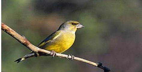
El verderón europeo es común en Martos

en humedales como es el caso de la laguna del Hituelo. Además es reseñable entre las aves domésticas el buchón marteño, la raza de paloma originaria de Martos. Entre los reptiles, habitan saurios como la salamanguera común y el lagarto ocelado, quelonios como el galápago leproso; ofidios como la culebra viperina, la culebra bastarda y la víbora hocicuda. En cuanto a los anfibios habitan el sapo común, rana verde y salamandra.