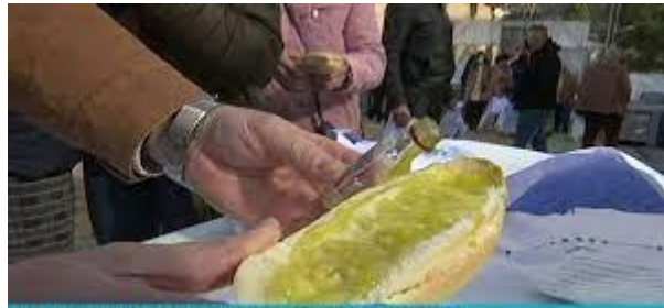
Hoyo del aceitunero