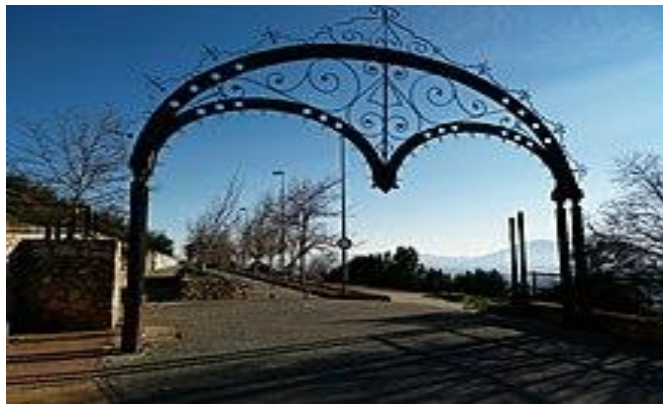
Paseo del Calvario