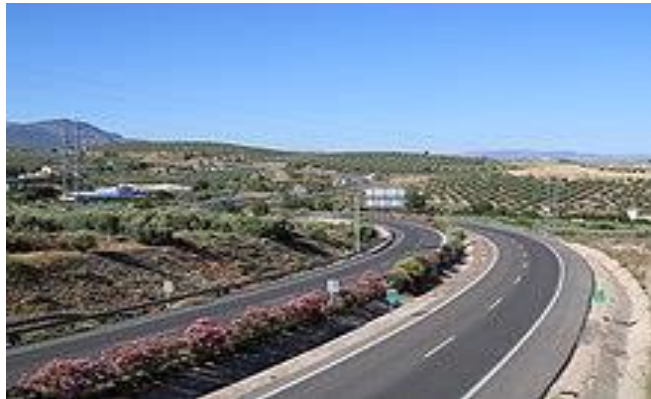
Autovia del olivar a su paso por la circunvalación de Martos

El tráfico urbano está regulado por el Cuerpo de policía local de Martos y gestionado por la concejalía de servicios públicos, tráfico y seguridad ciudadana del ayuntamiento, de acuerdo al artículo 7 de la Ley sobre tráfico, circulación de vehículos a motor y seguridad vial aprobado por RDL 6/2015, el cual atribuye a los municipios competencias específicas en materia de tráfico.