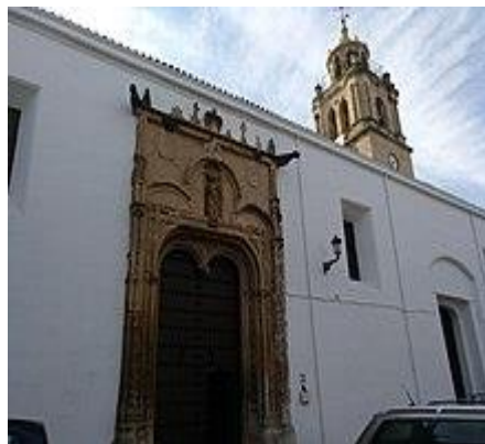
Real Iglesia parroquial de Santa Marta