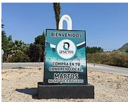
Escultura de la Asociación empresarial marteña, ubicada en una rotonda del municipio.

El sector terciario en Martos está compuesto por todos aquellos servicios necesarios para la población. La ausencia de grandes superficies en el municipio hace que todos estos servicios sean ofrecidos mayoritariamente por entidades minoristas, seguidas de entidades mayoristas. Dentro de este sector es considerable la existencia de comercios de ropa, bancos, cajas de ahorros y demás servicios públicos.