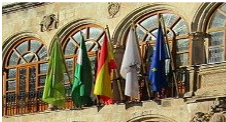
Banderas ubicadas en la fachada del ayuntamiento, entre ellas la marteña.