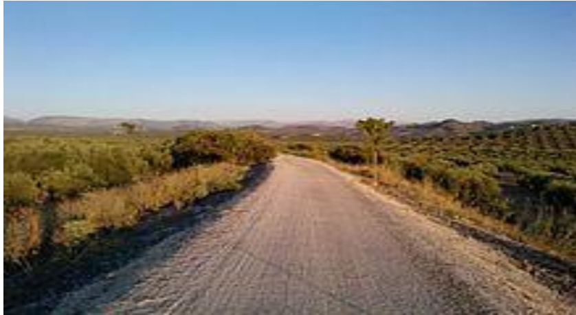
Vía verde del Aceite a su paso por el término municipal de Martos