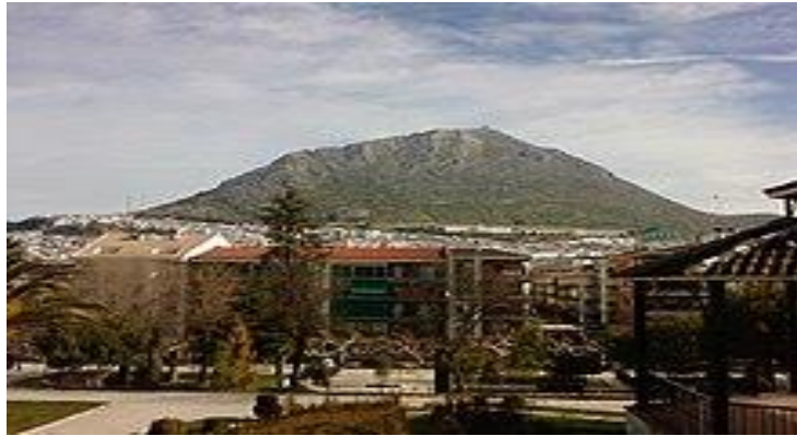
Peña de Martos vista desde el parque Manuel Carrasco