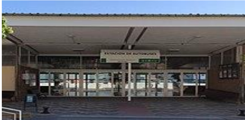
Estación municipal de autobuses de Martos.

todos los medios de transporte públicos de los municipios consorciados del ámbito metropolitano de Jaén, permitiendo por tanto aplicar un considerable ahorro económico en la utilización de los medios de transporte públicos, posibilitando la realización de transbordos. La tarjeta también puede ser utilizada en los otros consorcios de transporte metropolitano de Andalucía.