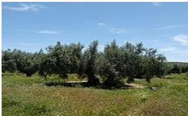
El olivo es símbolo de la economía tradicional en Martos

Históricamente la economía marteña ha girado en torno al sector agrario, debido a la riqueza y diversidad de su medio natural, en base al cual la población ha encontrado su principal fuente de supervivencia, aunque actualmente la economía se apoya en dos ejes productivos principales: El agrícola y el industrial, con gran presencia de este último en el municipio. Por otra parte el sector de la construcción ha sido otro eje principal en la economía marteña hasta el inicio de la crisis económica de 2008-2010, hecho que ha supuesto consecuencias nefastas en la economía local y que se ha materializado con el cierre de un gran número de empresas. De acuerdo con la información que facilita el Instituto de Estadística de Andalucía (IEA), en el ejercicio de 2008 se produjeron un total de 10 997 declaraciones de IRPF, con una renta neta media declarada de 16 061 euros.