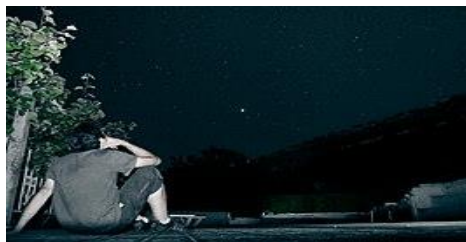
El Astroturismo se ha fortalecido tras la declaración de Reserva Starlight