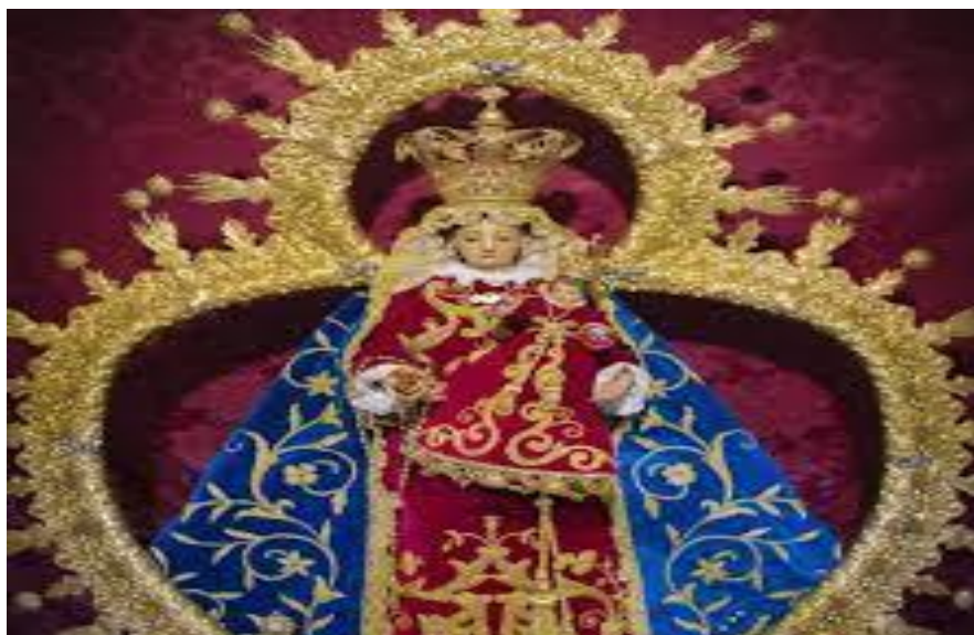
Virgen de la Victoria

junio de 2002 como Fiesta de Interés Turístico Nacional de Andalucía, la romería de la Virgen de la Victoria, declarada el 25 de julio de 2008 como Fiesta de Interés Turístico de Andalucía, y la fiesta de la aceituna, que se celebra el 8 de diciembre, marcando el inicio oficial de la campaña de recolección anual de la aceituna.