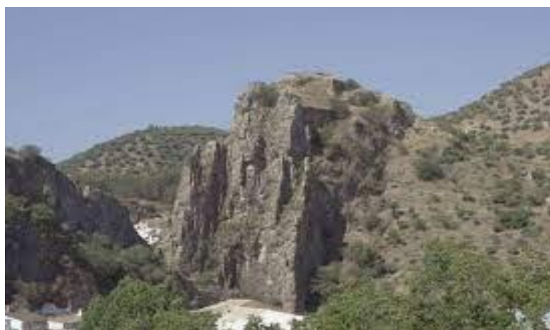
CASTILLO DE CAMBIL

Destacables ejemplos del barroco final o rococó en edificios civiles que forman parte del patrimonio singular del Cambil dentro de su conjunto histórico: