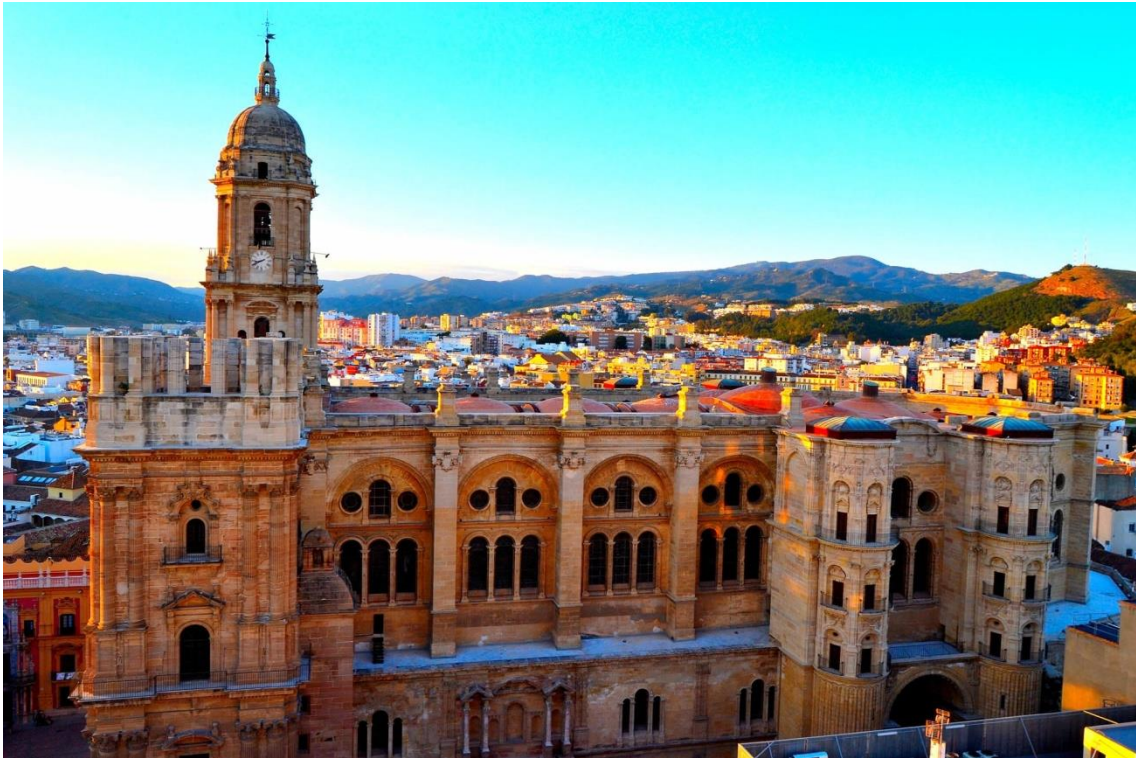
Catedral de la Encarnación

Tras la llegada cristiana a la ciudad, se construye la CATEDRAL DE LA ENCARNACIÓN , de estilo principalmente renacentista, pero con elementos barrocos; después de dos siglos de obras se interrumpió su construcción y la falta de una de sus torres le ha valido el apodo de «La Manquita». Entre sus más valiosos elementos destaca la sillería del coro, obra del imaginero Pedro de Mena. Junto a la catedral se encuentra el Palacio Episcopal, edificio barroco clasicista con una elaborada portada-retablo.