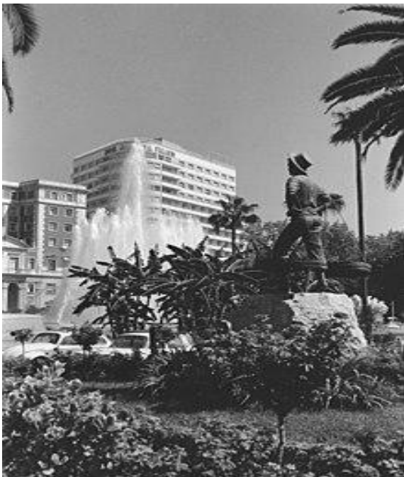
Estatua del Cenachero y plaza de la Marina

El comienzo del siglo XX es un periodo de reajustes económicos en el que se produce un progresivo desmantelamiento industrial y un errático comportamiento de la actividad comercial. Todo ello, en el seno de una sociedad atrasada y escasamente alfabetizada, en la que una ahora débil oligarquía ejerce el control económico y político. Conflictividad social, depresión económica y unas endeble estructuras de gobierno, fueron los principales problemas que hicieron que el republicanismo y los movimientos obreros reforzaran su presencia en la ciudad