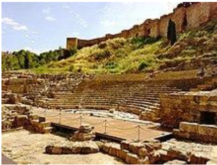
Teatro romano de Málaga

El primer asentamiento colonial data del año 800 a. C. y 500 a. C. localizado en la desembocadura del río Guadalhorce, en una isla que había en su estuario en un enclave conocido como cerro del Villar .