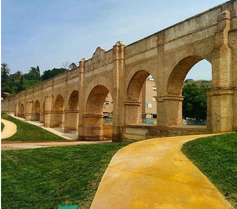
Acueducto de San Telmo

Del pasado industrial de la ciudad se conservan aún algunas estructuras como la Antigua Azucarera del Tarajal o la Chimenea de la central térmica de La Misericordia. Como notables obras de ingeniería pueden citarse el Acueducto de San Telmo, el Puente de los Alemanes o La Farola, finalizada en 1817, estando entonces situada en la entrada del puerto.