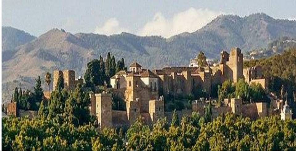
Alcazaba de Málaga