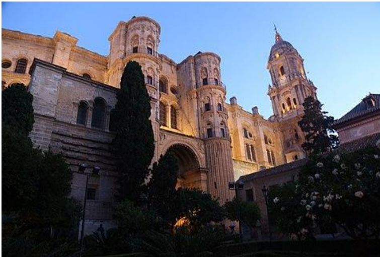
Catedral de Málaga

Bajo la influencia castellana , la ciudad comenzó a cambiar su trazado urbano e inició la construcción de la catedral de Málaga , cuyo arquitecto fue Diego de Siloé , sobre los cimientos de la mezquita mayor. Las iglesias y conventos construidos fuera del recinto amurallado empezaron a aglutinar población, dando lugar a la formación de nuevos barrios extramuros como La Trinidad o Capuchinos