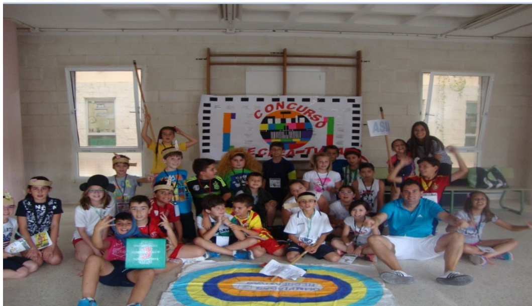
Unidad Didáctica 0 en Ed. Física: "Creciendo en Salud".

CEIP EL RECREO-41601954- (LEBRIJA-SEVILLA) Avda. Juan Peña "El Lebrijano" s/n (C.P. 41740)