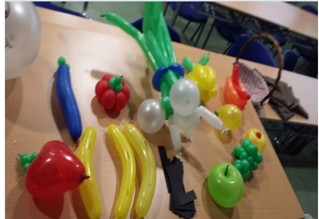
Talleres de globoflexia.