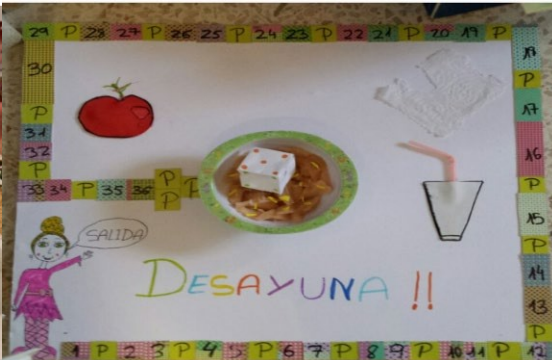
Investigación temática saludable con elaboración de tableros de juegos para el recreo.