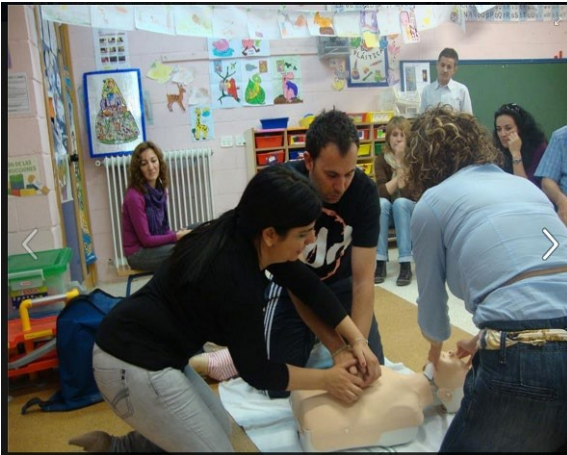
Talleres formativos para PAS, familias y docentes.