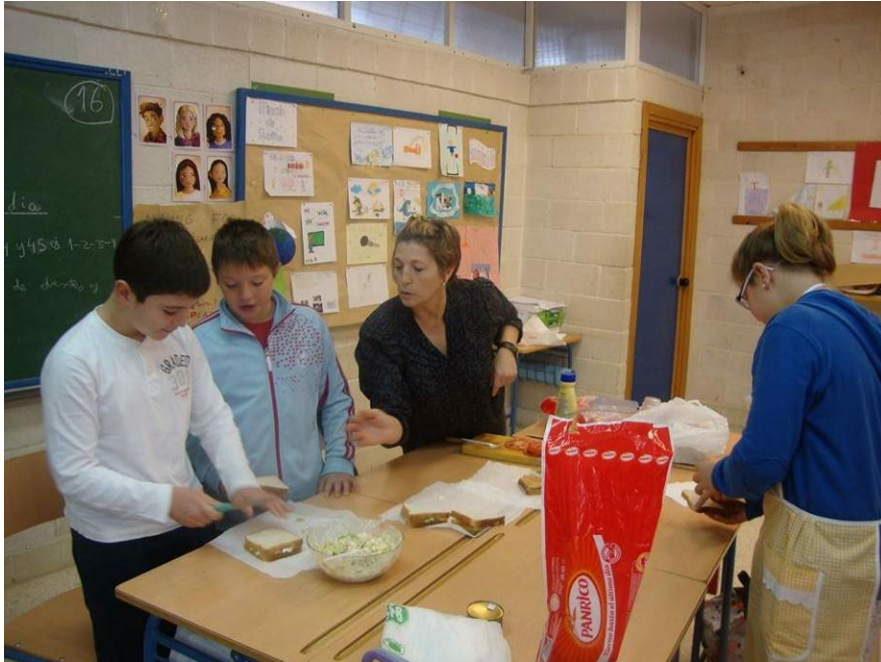
Talleres de Cocina Divertida (organizados por familias y personal de hostelería local).

CEIP EL RECREO-41601954- (LEBRIJA-SEVILLA) Avda. Juan Peña "El Lebrijano" s/n (C.P. 41740)