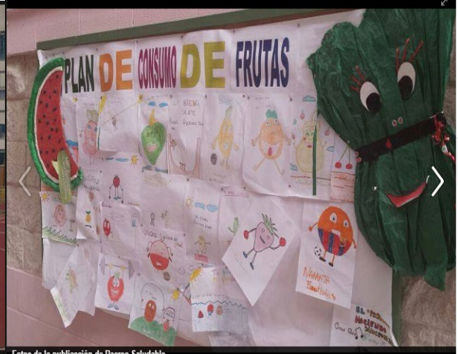
Tablón de anuncios del Plan.