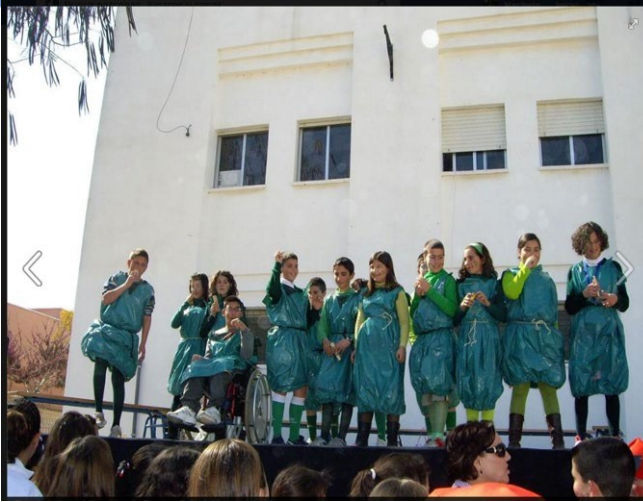
Celebración de Efemérides (Carnaval de frutas y verduras).