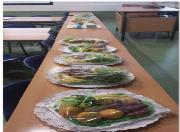
Olimpiadas Intercentros: Actividad física y Alimentación. Talleres de centros de mesas.