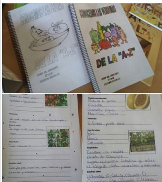
Diccionarios de frutas y de verduras.

- Programa de Televisión "Creciendo en Salud en el CEIP El Recreo".