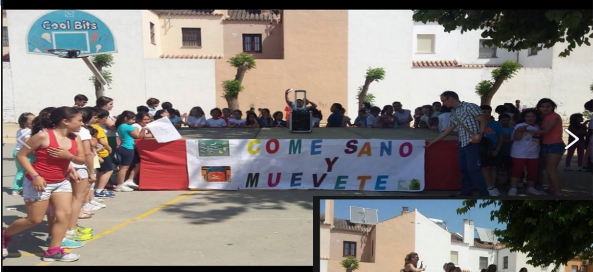
Semana del Frutibithón