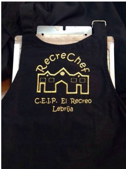
Delantales y gorros financiados por "apadrinamiento". Feria de la Salud (cepillos aportados por dentistas locales)