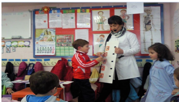
Elaboración de Trabajos por Proyectos para Ed. Infantil y Ed. Primaria