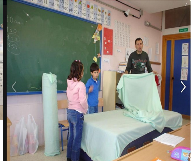
Semana de la Igualdad