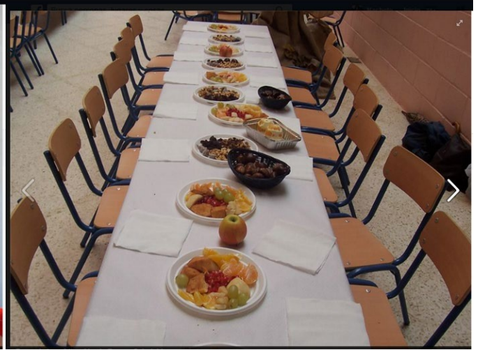
Fiesta de los frutos por estaciones.