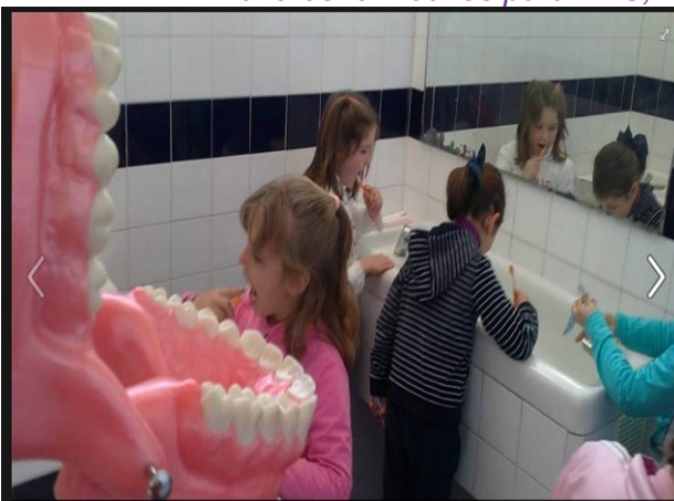
Cepillado de dientes diario.