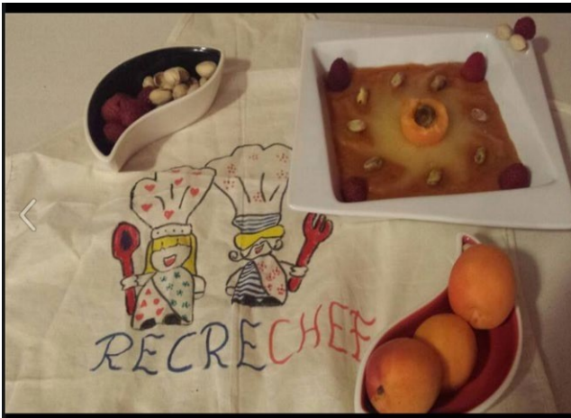
Recetarios de cocinas: Primer Premio 2015 y Finalistas 2014.