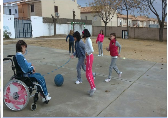
Proyecto: "Recreos ecosaludables para un recreo no sexista"