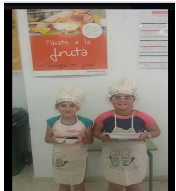
Talleres de Cocina Recreativa y divertida.