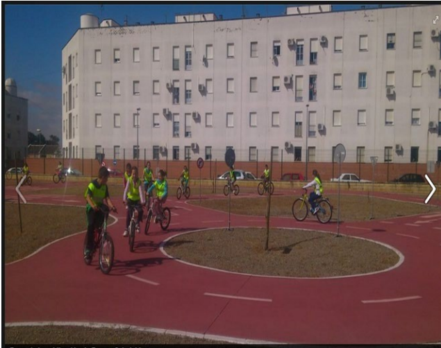
Cursos de Educación Vial para el alumnado