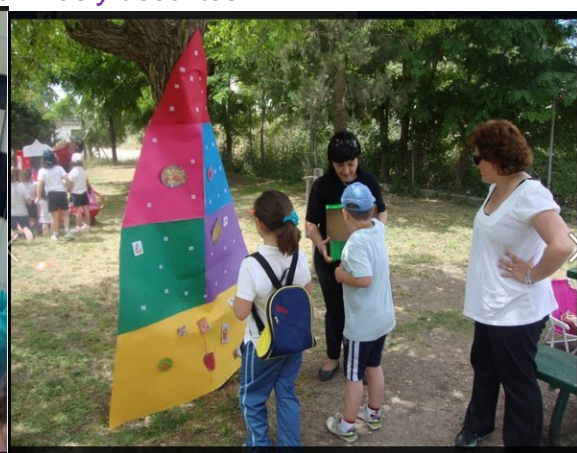
Feria de la Salud.