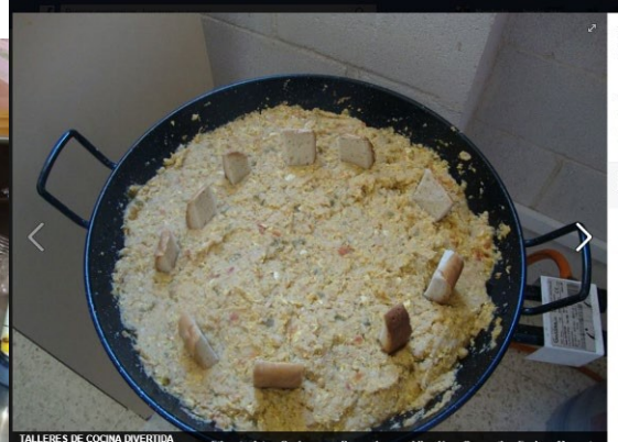
Elaboración de platos en clase.