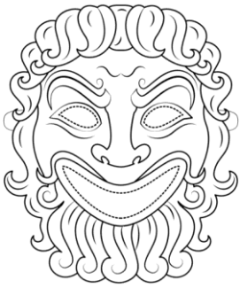
Máscaras del teatro

Le encantaban el teatro y las competiciones deportivas creando las olimpiadas.