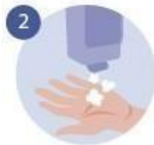
2 DESPUÉS JABÓN