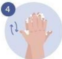
4 FROTAMOS BIEN, POR DELANTE Y POR DETRÁS