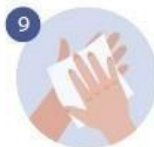
9 NOS SECAMOS BIEN LAS MANOS