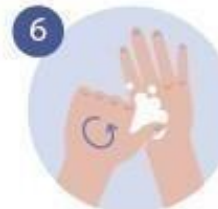
6 FROTAMOS LOS DEDOS GORDOS