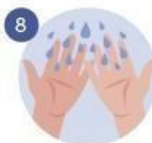
8 NOS QUITAMOS TODO EL JABÓN CON AGUA