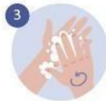
3 EMPEZAMOS A FROTAR, HACIENDO ESPUMA