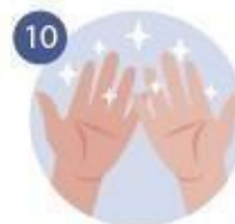
10 YA TENEMOS LA MANOS SÚPER LIMPIAS