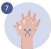
7 FROTAMOS ENTRE LOS DEDOS