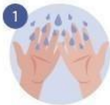
1 NOS ECHAMOS AGUA