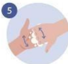
5 FROTAMOS LOS DEDOS, CON LA PALMA CONTRARIA