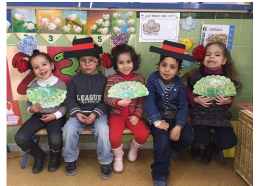
DÍA DE ANDALUCÍA

"...La entrada en la escuela supone un cambio sustancial en la vida de un niño/a, ya que sale de un ambiente familiar en el que frecuentemente es el centro de atención y encuentra un ambiente nuevo y desconocido que le crea una cierta inseguridad..."