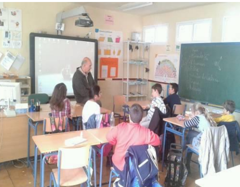
HÁBITOS DE VIDA SALUDABLE