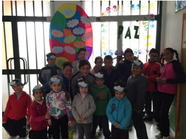
DÍA DE LA PAZ