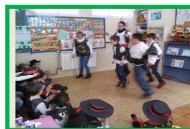
y los mayores...