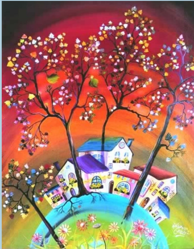
“La naturaleza implora” de Alejandro Costas