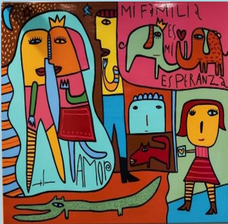
“El juego y La familia” de Milo Lockett.

SLOGAN DEL MES: “La convivencia en la familia”