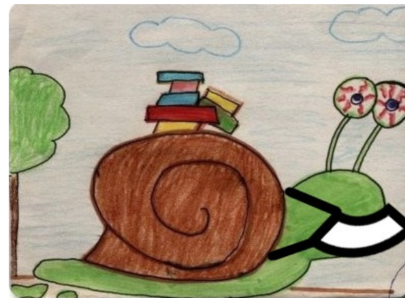
CEIP "REINA FABIOLA" -MOTRIL-