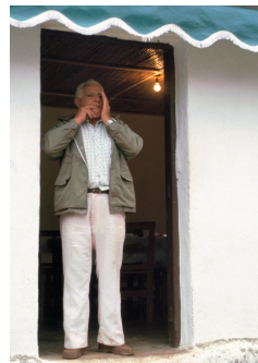
Imagen en Wikimedia Commons de Alkavin bajo CC