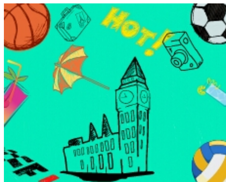
Imagen de las locas de la colina en Wikimedia Commons bajo licencia CC

En ocasiones una sola palabra ("¡Vacaciones!") o una oración ("Mañana comienza el verano") pueden constituir un texto, ya que transmiten un mensaje completo; sin embargo, lo habitual es que éste conste de un conjunto de oraciones. Lola miró varios folletos publicitarios sobre vacaciones: