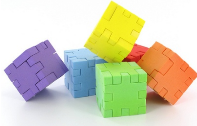
Imagen en Flickr de Creative Tools bajo CC.

Hemos visto una serie de palabras variables. Ya dijimos que son aquellas que cambian de forma. Ahora vamos a estudiar el grupo de palabras que no pueden cambiar. Son, por tanto, las palabras invariables .