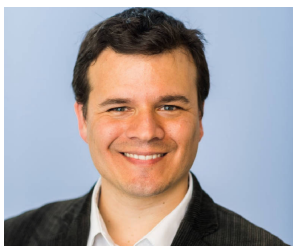
D. Pablo Jarillo-Herrero Massachusetts Institute of Technology

El jurado destaca la relevancia e impacto de sus trabajos seminales en la física de los materiales bidimensionales con propiedades electrónicas y magnéticas de interés. El descubrimiento de la superconductividad en bicapas de grafeno rotadas ha sido uno de los hitos más importantes de la física de la materia condensada en los últimos años. Sus contribuciones pioneras han posibilitado la comprensión de las propiedades topológicas, magnéticas y superconductoras de los materiales bidimensionales y el desarrollo de dispositivos electrónicos.