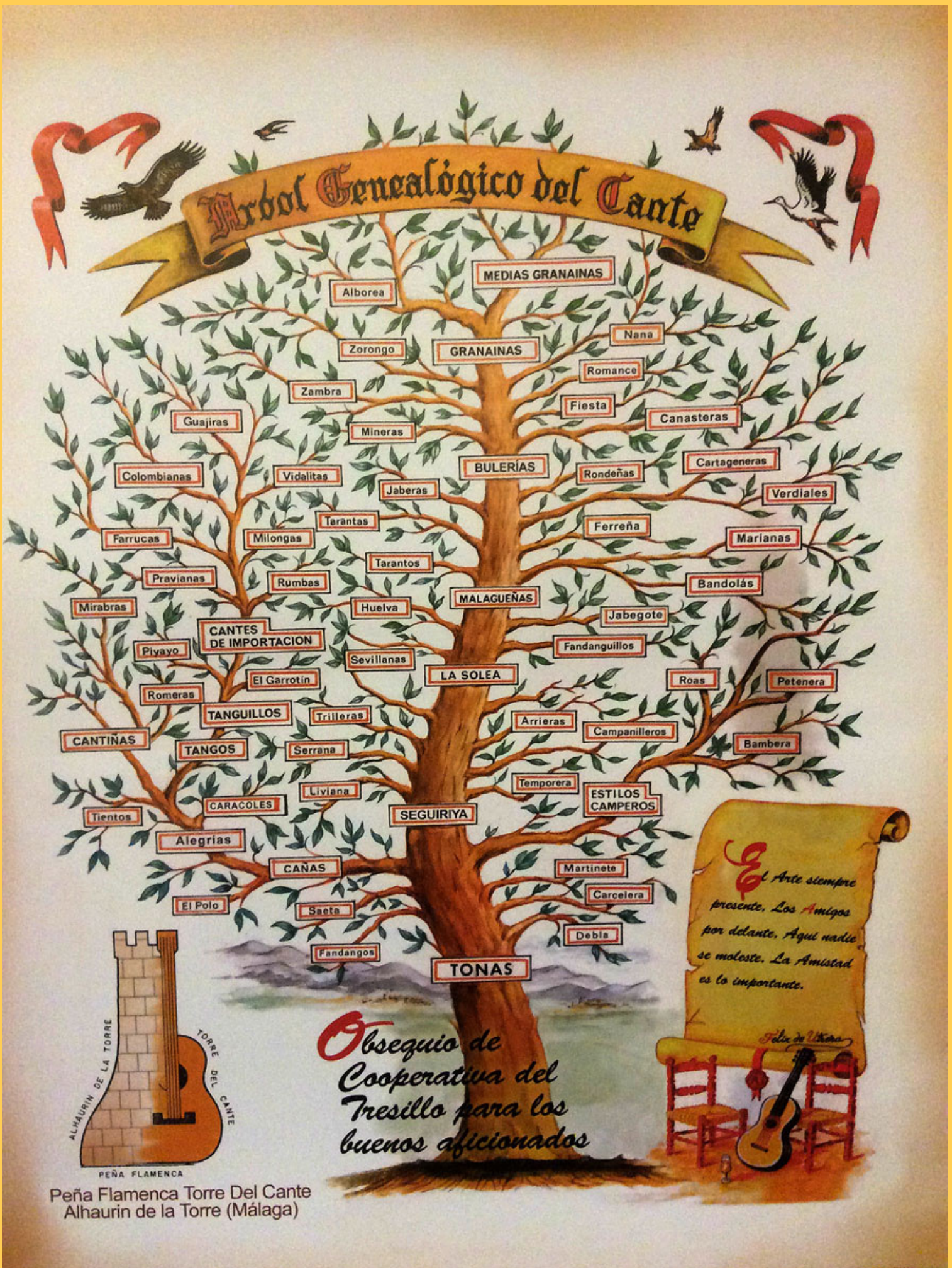
Peña Flamenca Torre Del Cante Alhaurin de la Torre (Málaga)