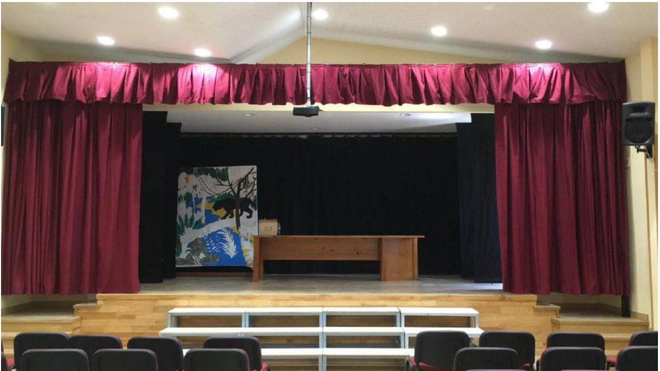
Detalle del salón de actos con el telón adquirido y el decorado al fondo