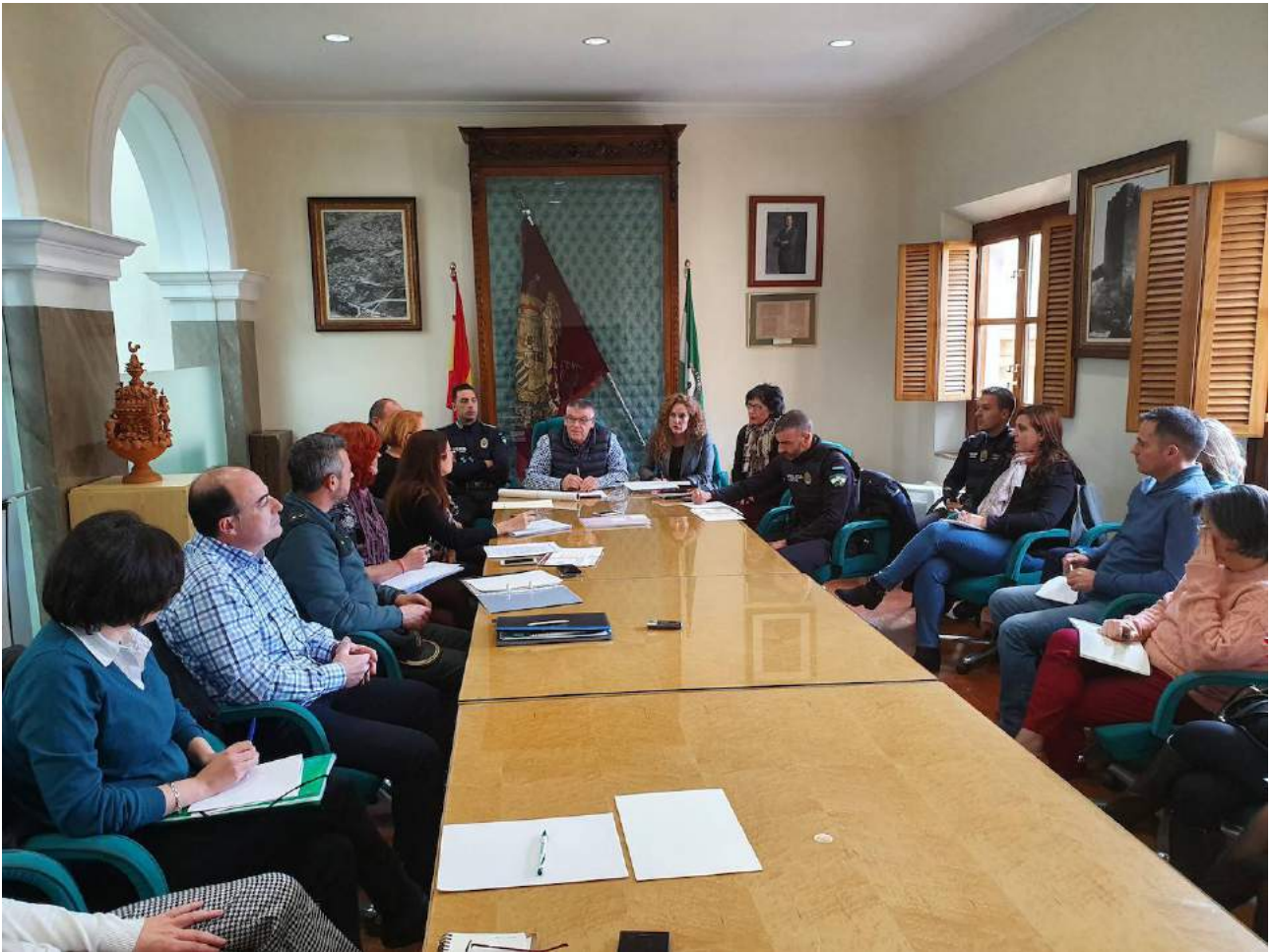
Comisión comarcal para la atención a mujeres víctimas de malos tratos de Guadix, 15 de noviembre de 2019.