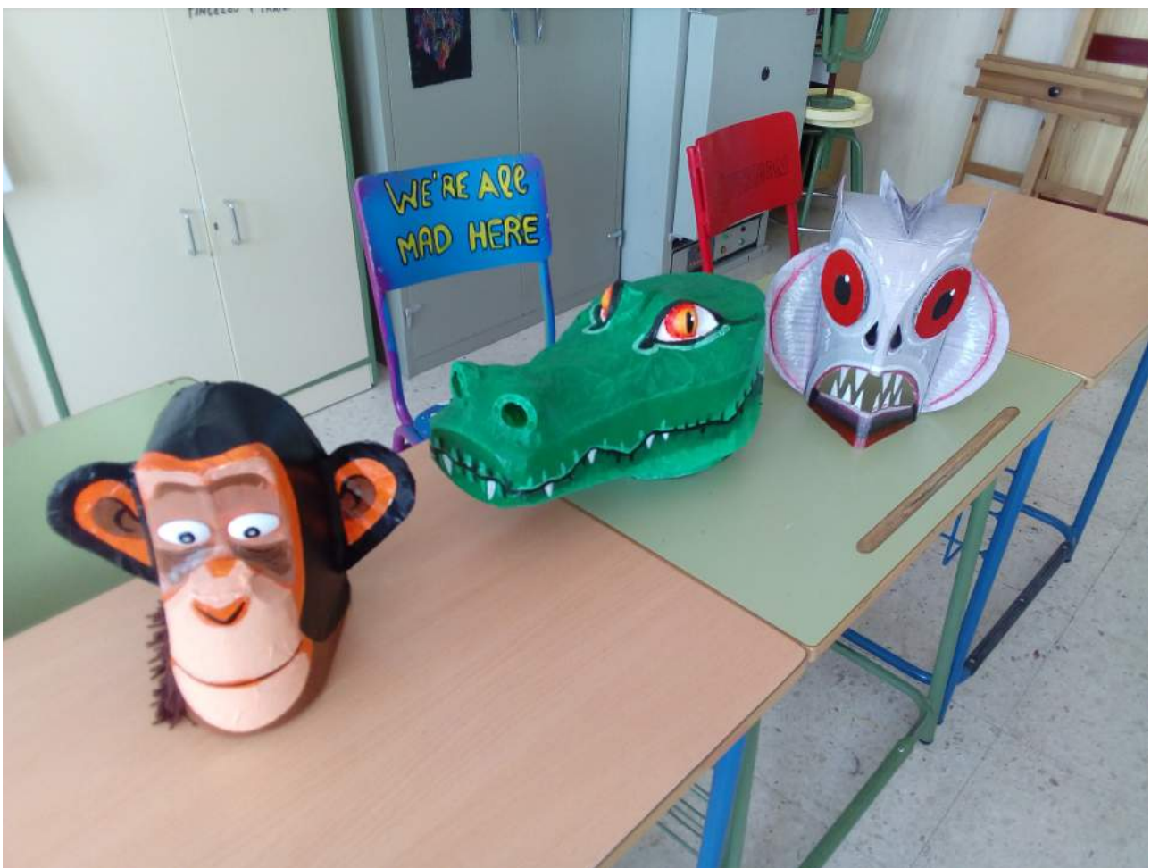
Máscaras de personajes realizados con materiales de desecho