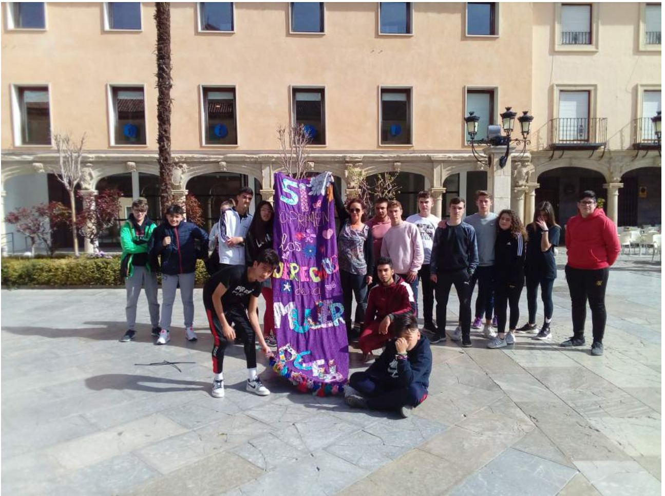
Alumnado portando la pancarta el día de la manifestación