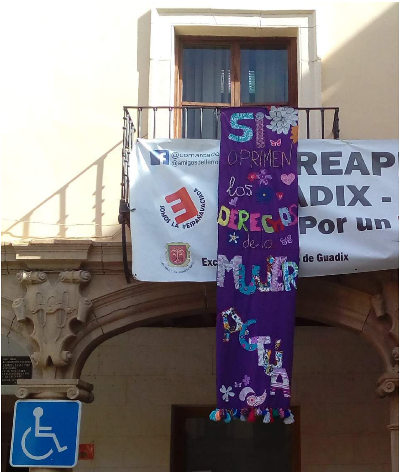
Pancarta del IES ACCI, colgada temporalmente en el Ayuntamiento de Guadix