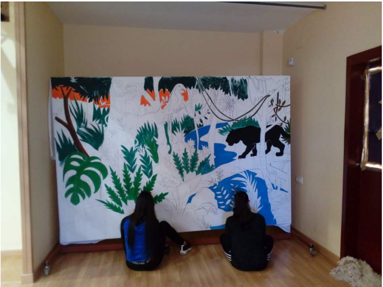
Alumnas de 4ºESO pintando el decorado