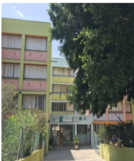
Entrada al Instituto

Además de tu clase, (aula de referencia), hay otros espacios que facilitarán que tu aprendizaje sea mejor. Los irás descubriendo conforme vaya avanzando el curso. Te enseñamos algunos de ellos: