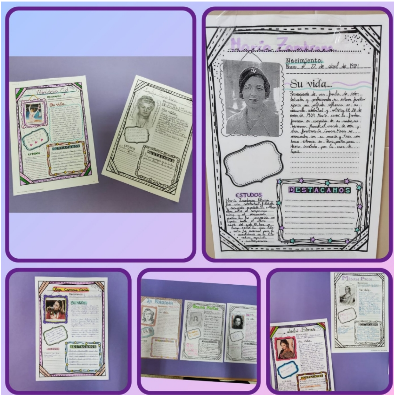
En el #iesaxati seguimos trabajando por la igualdad. En esta ocasión, el alumnado de ESO y Ciclo Formativo de Grado Básico ha elaborado biografías de mujeres pioneras en diferentes campos.