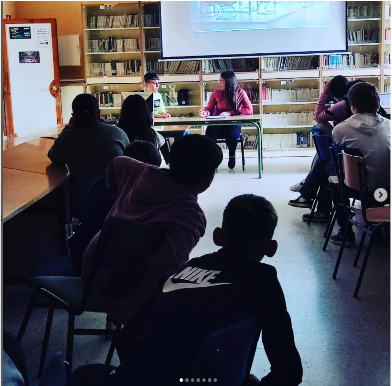
Teatros sobre la igualdad entre hombres y mujeres, representados por el alumnado de 4º ESO B para sus compañeros de 1º ESO, con motivo del mes de marzo #8marzo #igualdaddegenero #iesaxati #loradelrio