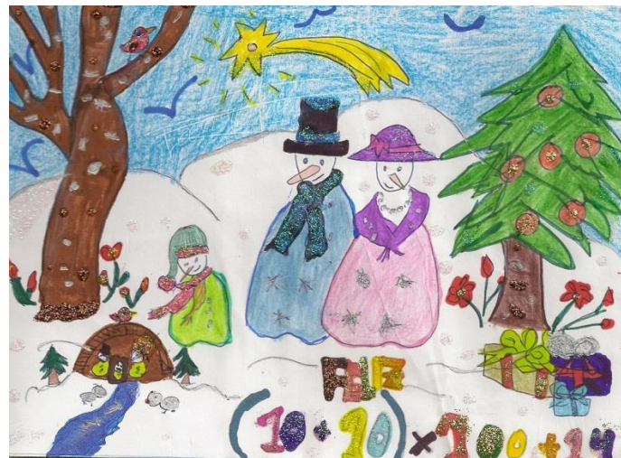
1º PREMIO: Belén Carrasco Jiménez 1º ESO B