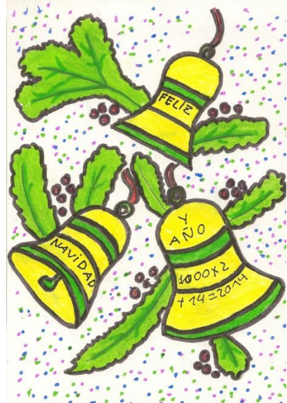
3º PREMIO: M a de los Ángeles Peñas Rojo 4º ESO