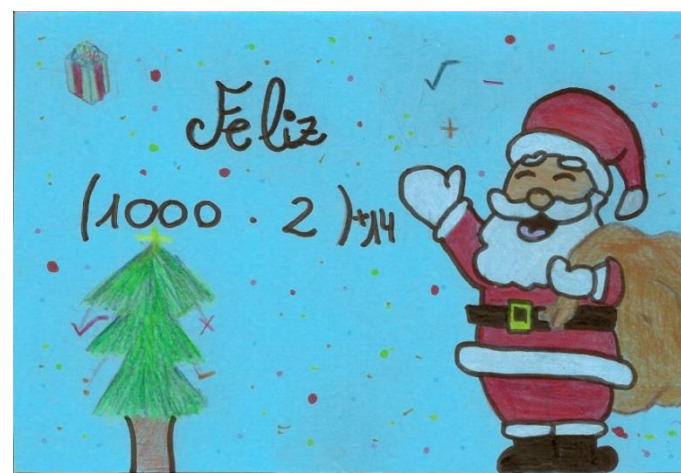
PARTICIPANTE: Cristina Capote Cornejo 1º ESO B