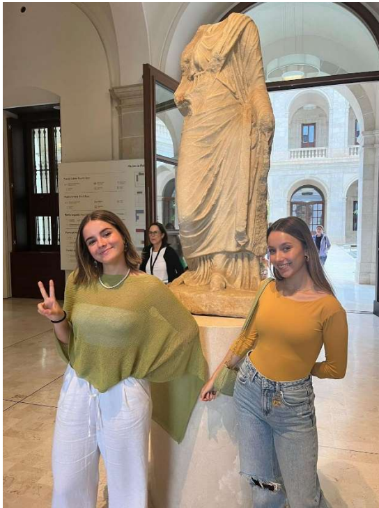
Estilo: Arte romano - Autor: Desconocido

Esta escultura de autor desconocido es la que te da la bienvenida al entrar al museo de la Aduana de Málaga. Se menciona que su construcción fue realizada en un taller local a finales del siglo I o principios del siglo II. La pista de este taller local nos la da,