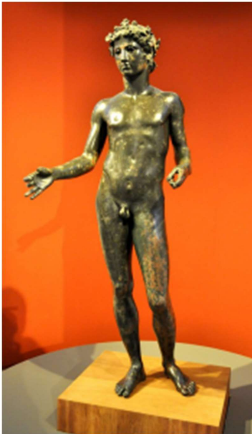
Estilo: Arte romano - Autor: Desconocido

El joven que representa la imagen es de tan excelente belleza que resulta imposible no quedarse admirado al contemplarlo, por su ligereza, armonía y elegancia. Esta excepcional escultura está hecha por Romero Pérez M., es de bronce, de la época romana, siglo I y fue encontrada ocasionalmente en las labores de labraza con un tractor en un cortijo de la Vega de Antequera alrededor de 1955.