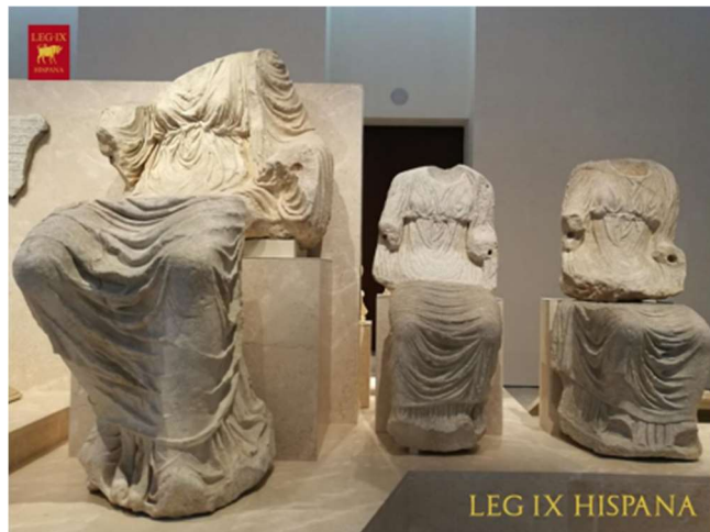
Estilo: Arte romano - Autor: Desconocido

Se trata de tres esculturas encontradas en el Museo Arqueológico Nacional (Madrid), encontradas en la Plaza del Pilar Alto (Cártama). Proviene de la época romana (estimadamente a mediados del siglo II d.C.)