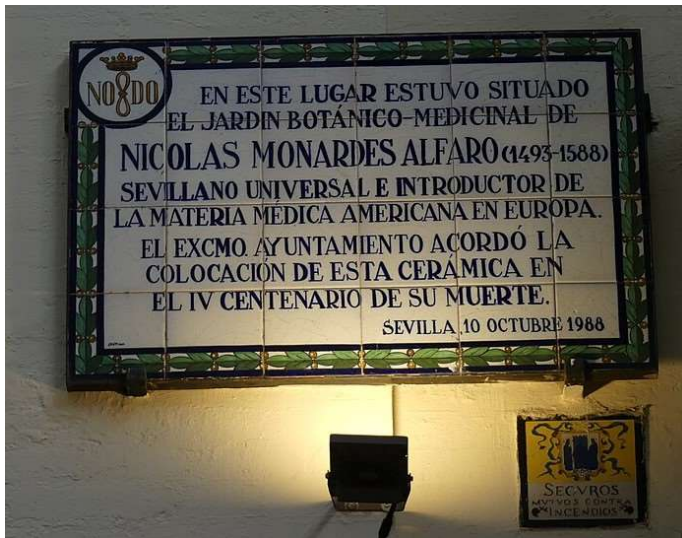
Placa cerámica homenaje a Nicolás Monardes, situada en el lugar donde se ubicaba el jardín de aclimatación (calle Sierpes, número 19).

El jardín de Monardes no fue el único existente en la Andalucía del XVI. Antes de este siglo, los jardines andaluces se poblaban tradicionalmente con especies mediterráneas o del norte de Europa, junto a las procedentes de Asia que quedaron incorporadas a nuestra cultura por los romanos o los árabes, estos últimos por la vía andalusí y, también, por el intercambio derivado de las Cruzadas. Tras la fecha de 1492, los contactos de españoles y portugueses con América se tradujeron en el intercambio de especies, muchas de ellas cultivadas en los distintos jardines de