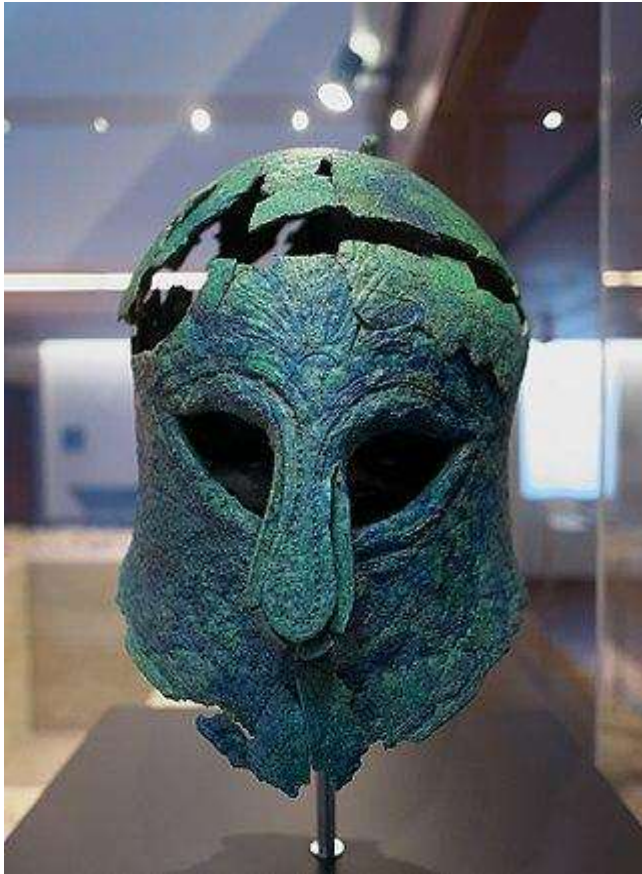
Estilo: Corintio - Autor: Desconocido

La “Tumba del guerrero” fue descubierta en el año 2012 en un solar entre las calles Refino y Jinetes de la capital malagueña. Junto a los