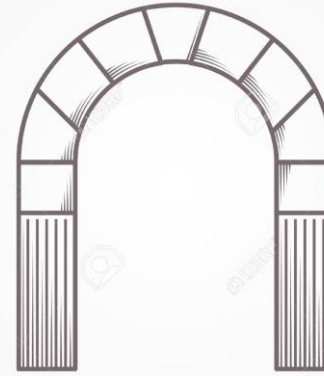
Arco de medio punto

Se construyen sobre todo iglesias y palacios, pero también ayuntamientos, universidades, hospitales y bibliotecas.