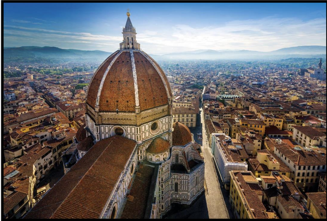
Cúpula del Duomo de Florencia (1296-1418)