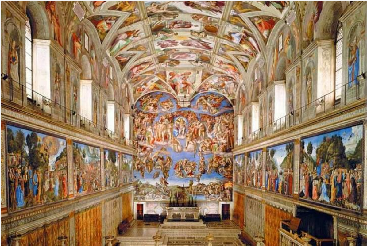
Frescos de la Capilla Sixtina (Miguel Ángel, 1508-1512)