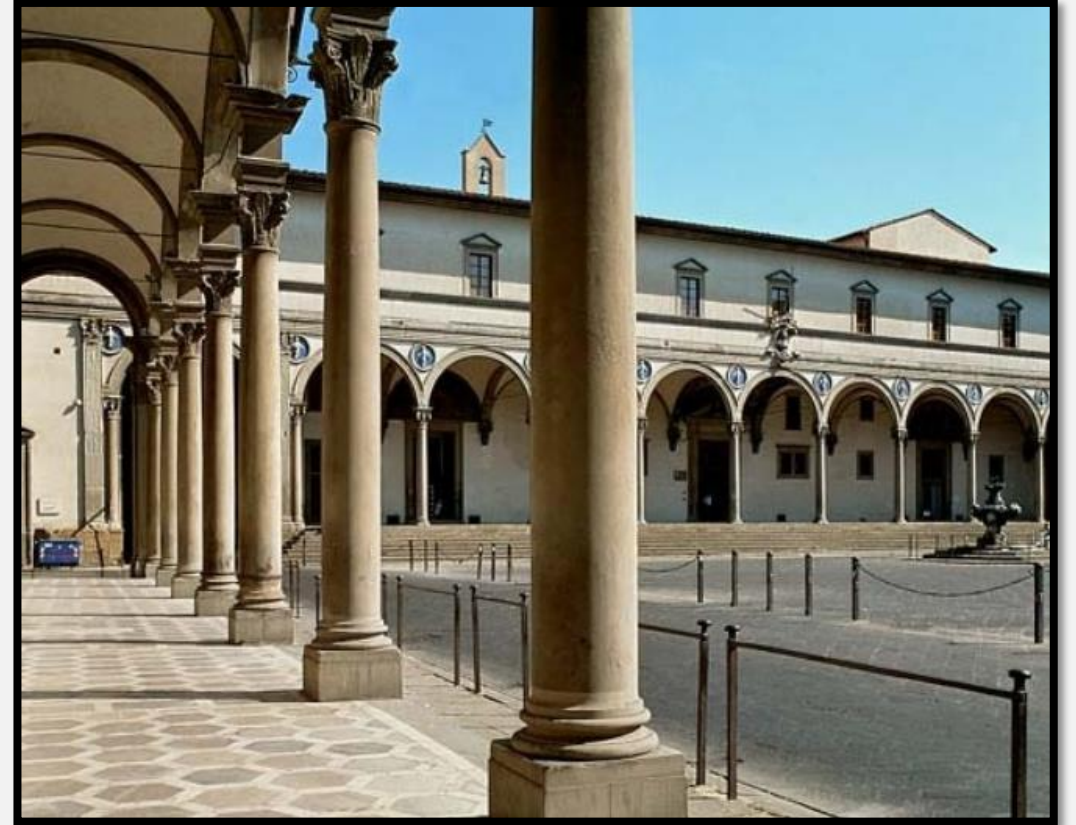
Hospital de los Inocentes de Florencia (1419)