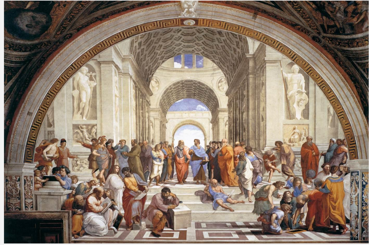
La Escuela de Atenas (Rafael, 1510-1511)