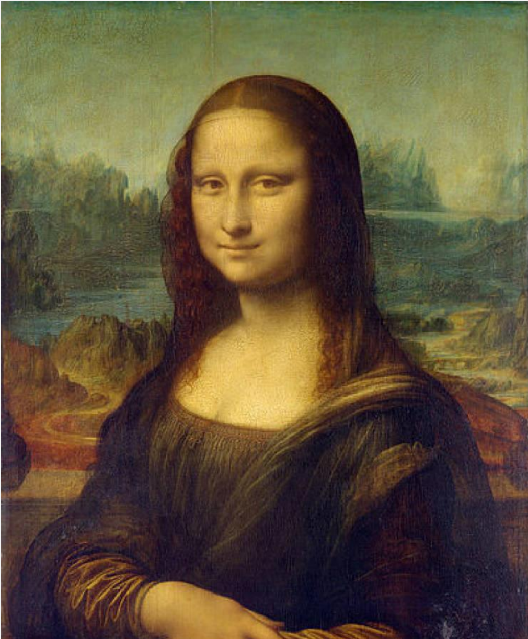
La Gioconda o Mona Lisa de Leonardo da Vinci (1503-1519)