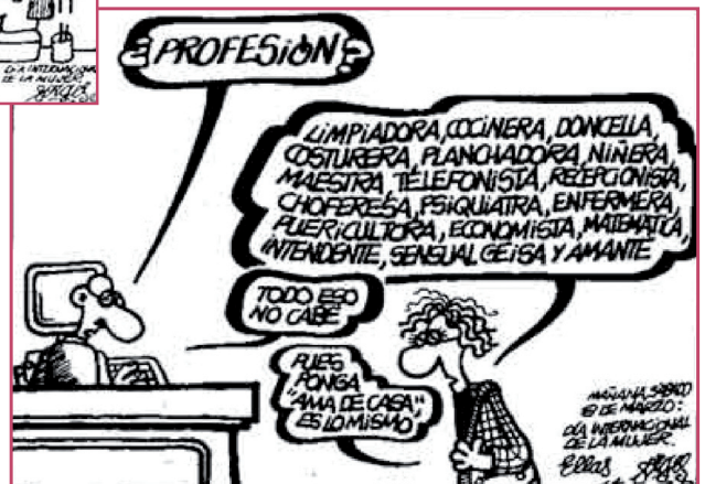
Forges. Chiste gráfico de 1997.