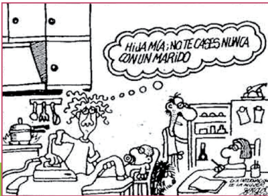
Forges. Chiste gráfico de 1996.

- Medios de comunicación. De las 12 televisiones autonómicas, sólo Baleares aporta un nombre femenino, según la Agenda de la comunicación editada por la Presidencia del Gobierno. No hay más de cuatro mujeres en la dirección de 40 agencias de información general, todos los periódicos nacionales de pago de gran tirada tienen un presidente o director al frente, y también los deportivos y los de información económica. Las revistas generalistas, televisiones nacionales y radios tienen mayoritariamente a un hombre como director.