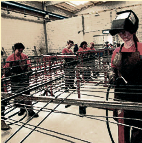
Trabajadoras en una fábrica de prefabricados catalana con una plantilla exclusiva de mujeres.

En 1996, sólo una de cada 10 consejeros era mujer (11%). Andalucía, con