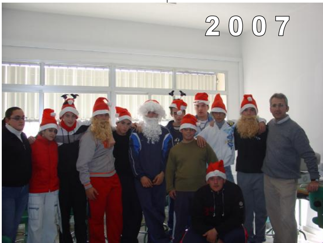
I.E.S. MONTES ORIENTALES. IZNALLOZ (GRANADA).