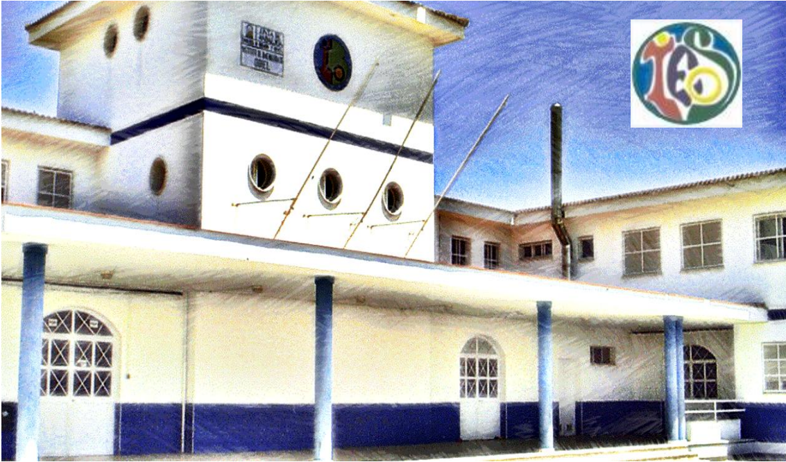
CENTRO IES ODIEL (Gibraleón, Huelva) CÓDIGO: 21700034

"Gestión es hacer las cosas bien, liderazgo es hacer las cosas" Peter Drucker