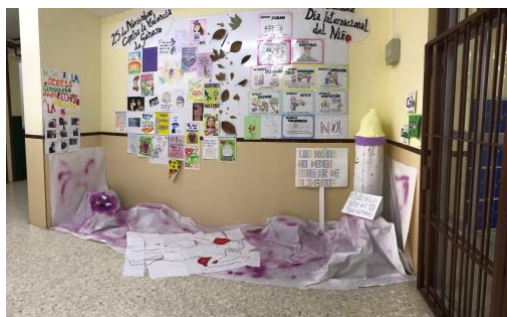
Muro para exposiciones de nuestro insituto

Como sabéis el 25 de noviembre se celebra el Día Internacional Contra la Violencia a la Mujer. Desde nuestro centro queremos realizar una serie de actividades relacionados con esta celebración. Se realizarán charlas-taller para algunos cursos del centro, así como una "performance" realizada por alumnas y alumnos del Ciclo de Infantil de nuestro instituto. Por otra parte, invitamos a todo el alumnado del centro a realizar carteles, dibujos, poesía, trabajos manuales para exponer en nuestro "muro" que reivindique la lucha contra la violencia de género.