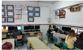
MADERA MUEBLE Y CORCHO