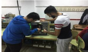
ELECTRICIDAD / ELECTRONICA