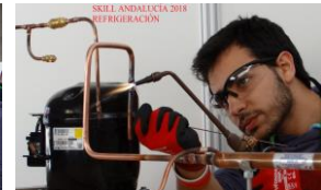
INSTALACIÓN Y MANTENIMIENTO