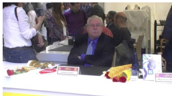
Joaquín Leguina, expolítico y escritor.