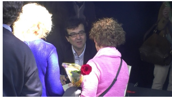
Javier Cercas, novelista.