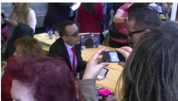
Risto Mejide, presentador de televisión y autor de libros.