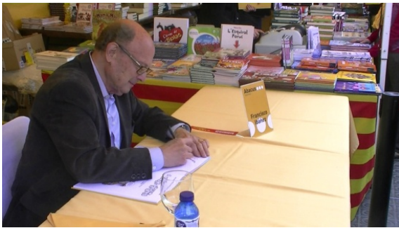
Francisco Ibáñez, dibujante de cómic. Autor de los personajes Mortadelo y Filemón.