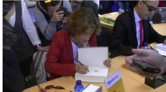
Julia Navarro, periodista y novelista.