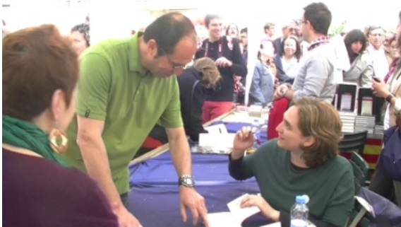
Ada Colau, activista social y política.