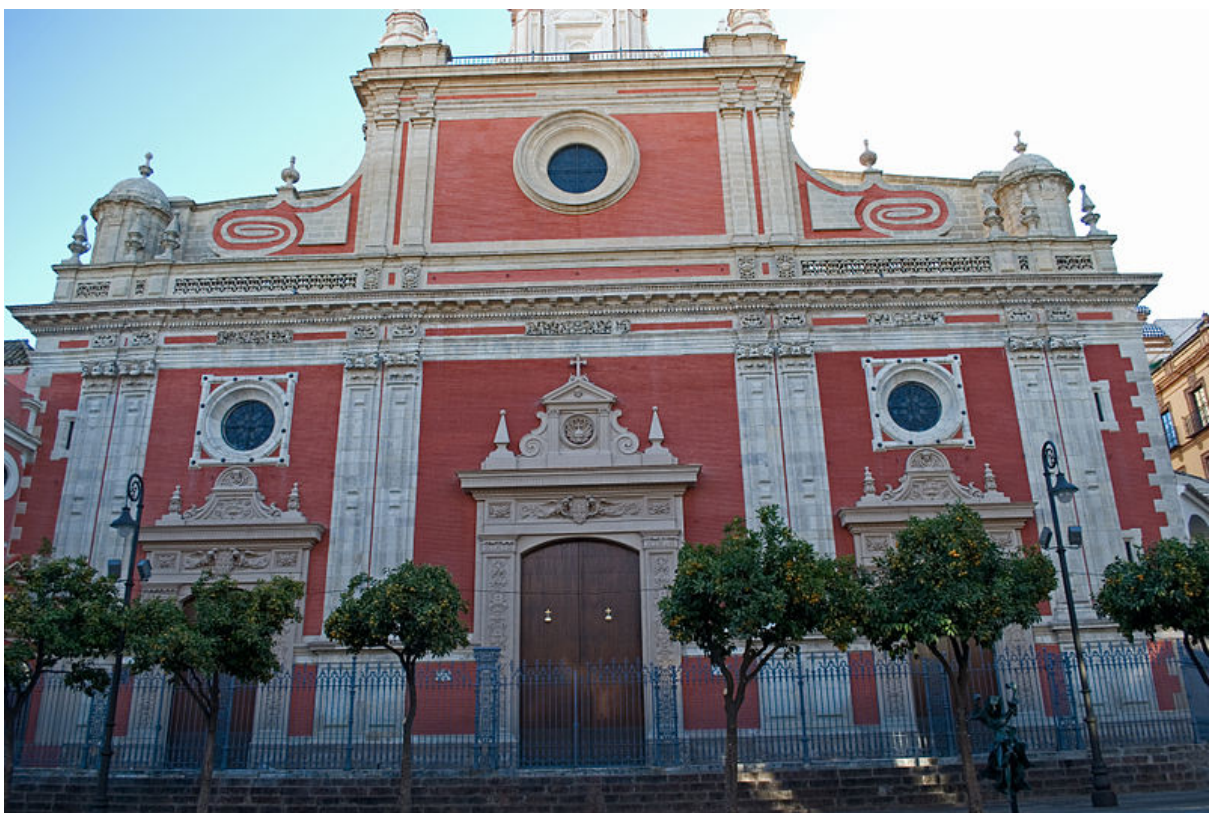
Teatro lopez de Vega

https://es.wikipedia.org/wiki/Archivo:Iglesia_del_Salvador_004.jpg