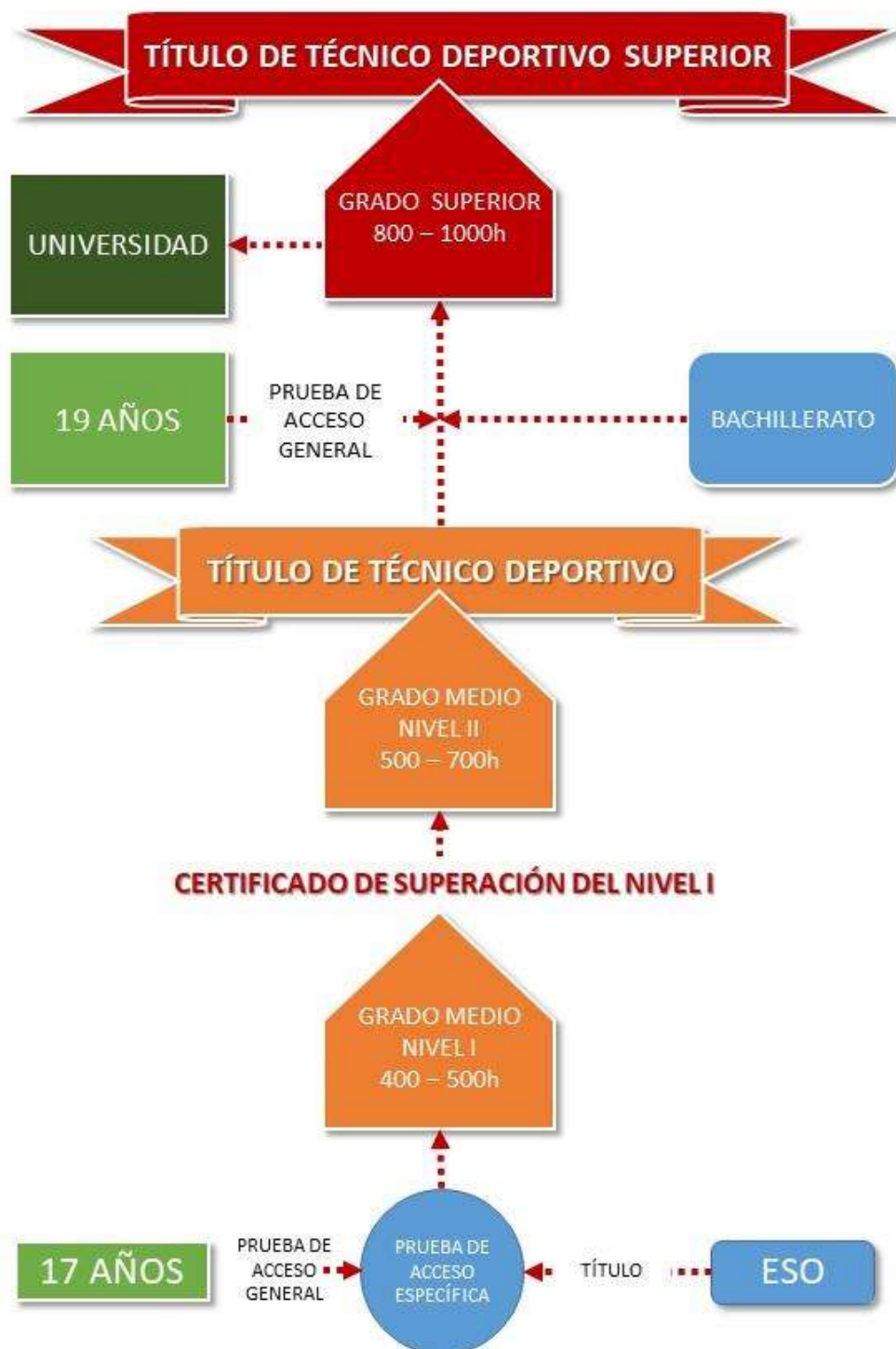
Ilustración 3 EDRE