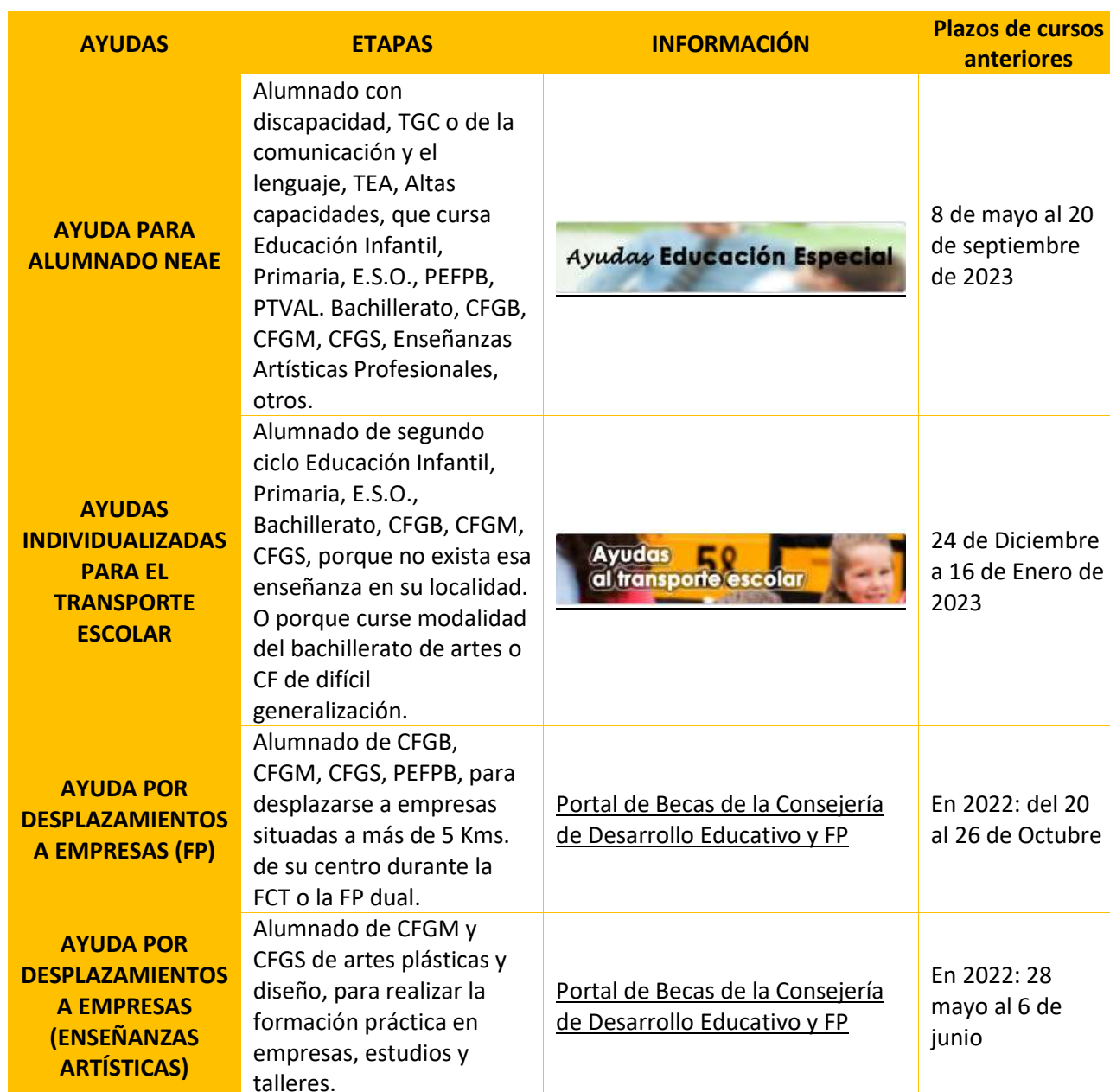
Tabla 27 Ayudas al estudio