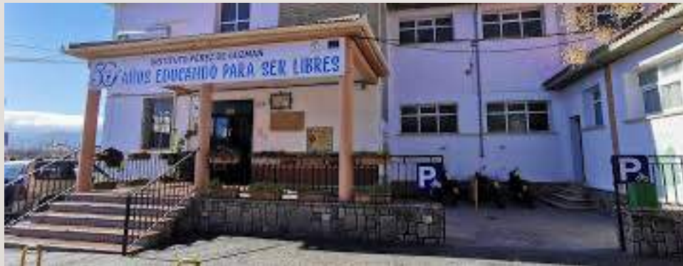
IES PÉREZ DE GUZMÁN EN RONDA

SE IMPLANTA ESTE AÑO POR PRIMERA VEZ EN MÁLAGA