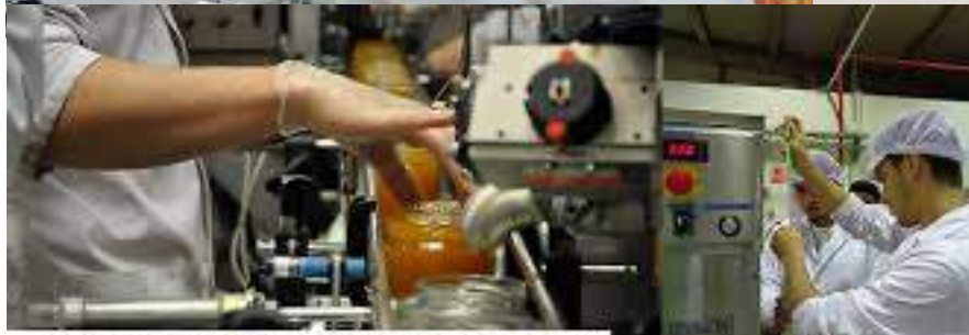
ELABORACIÓN DE PRODUCTOS ALIMENTICIOS. CICLO DE GRADO MEDIO