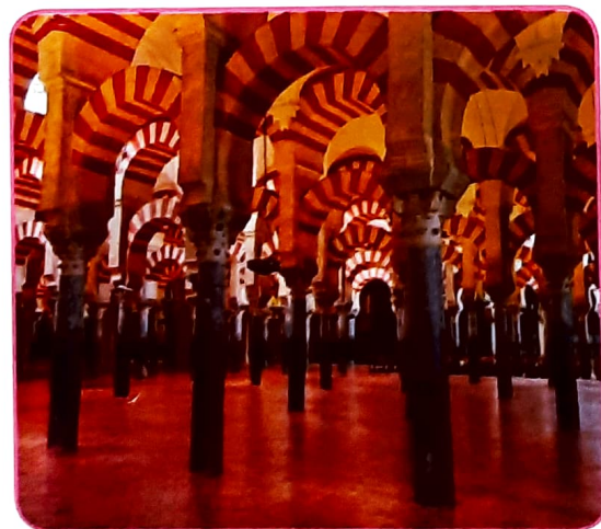
La Gran Mezquita de Córdoba

Al-Ándalus fue un brillante centro cultural, artístico y educativo. Las personas sabias del momento llevaron a cabo numerosos avances en medicina, geografía, literatura y filosofía. Los musulmanes construyeron magníficos edificios, como la Alhambra de Granada o la Gran Mezquita de Córdoba.