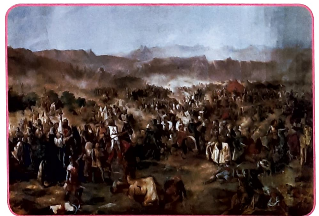
Batalla de las Navas de Tolosa