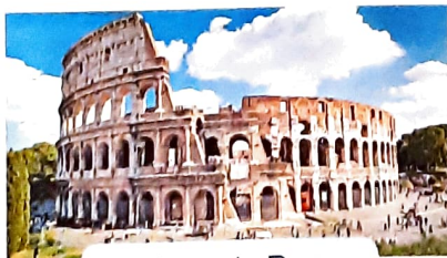
Coliseo de Roma LXXXIII

2 Escribe el año en el que se construyeron estos edificios.