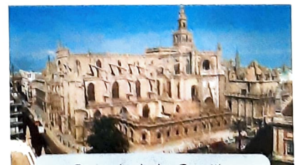
Catedral de Sevilla MDXCIII