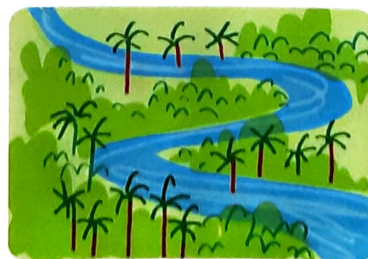
El río Amazonas.