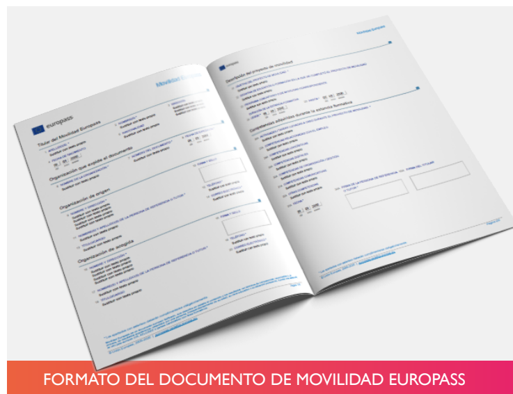
FORMATO DEL DOCUMENTO DE MOVILIDAD EUROPASS

3. Una vez que el DME haya sido comprobado y aprobado por la institución extranjera, el DME lo recibirá la Comunidad Autónoma de referencia del participante, la universidad correspondiente o el SEPIE para validarlo finalmente, si procede, o poner algún reparo que se tendría que subsanar. En el caso de que la institución de origen no tramite el DME por defecto, el interesado deberá ponerse en contacto con dicha institución nacional y solicitar la tramitación de su Documento de Movilidad con el Centro Nacional Europass. Es posible encontrar información adicional, así como videos explicativos sobre cómo tramitar el DME en este enlace